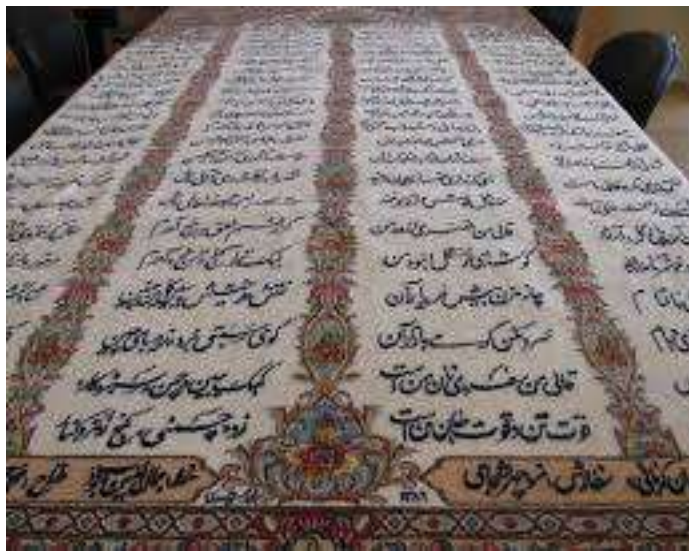
تصویر شماره ۳ تصویر قالی کرمان با طرح شعر پارسی