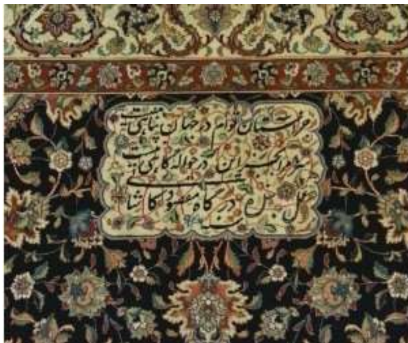
تصویر شماره ۲ تصویر قالی کاشان با طرح شعر پارسی

می توان ادعا کرد که قافیه در این شعر مولانا به دلخواه یا به اجبار نیامده است و جزء صورت شعر نیست، بلکه از سیرت آن مایه و نشأت می‌گیرد، فخامت غزل ایجاب کرده است که مولانا غزل را به قافیه آ/منتهی کند.