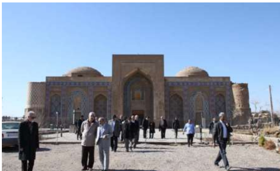
تصویر ۲: مدرسه غیاثیه خرگرد، قهستان، قرن نهم هجری-قمری (ایرانی، ۱۳۹۱: ۱).

نمونه این مدارس نیز در قهستان وجود داشته که یکی از مدرسی که می توان از آن نام برد، مدرسه غیاثیه خرگرد می باشد. آندره گذار در سال ۱۳۱۹ هجری- قمری آن را بررسی نموده و نقشه آن را ترسیم کرده است و چنین بیان کرده است که این اولین بنای چهار ایوانی ایران بوده که در عصر سلجوقی بنا شده است (تصویر ۲). آثار اندکی از این مدرسه به جا مانده که در حال حاضر در موزه آثار اسلامی تهران نگهداری می شود. کتیبه ایی با ابعاد ۴۰ متر طول و یک متر و ده سانت عرض در این بنا در شمار بلند ترین کتیبه ها قرار دارد. این کتیبه از گل قالب ریزی شده ساخته شده است (ایرانی، ۱۳۹۱: ۴). علاقه و توجه مردم این منطقه به تعلیم و تربیت و اهمیت دادن به ارتقای سطح فرهنگ جامعه در طول تاریخ نمایان است.