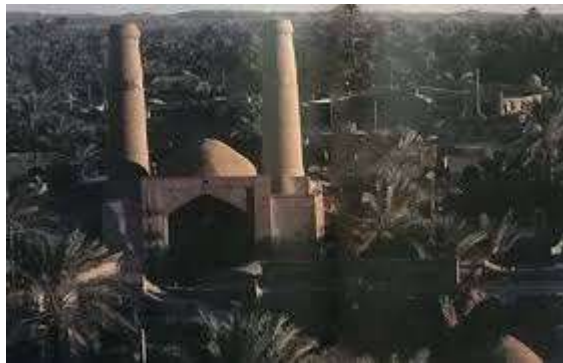
تصویر ۳: مدرسه دو منار طبس، قرن پنجم هجری- قمری، (سازمان میراث فرهنگی شهرستان طبس، ۱۳۹۹).

علم دوستی موجب شده بود تا مردم این منطقه با تمام محدودیت هایی که در طول تاریخ داشتند، همواره در این مسیر پیشگام و پیشقدم باشند (تصویر ۳).