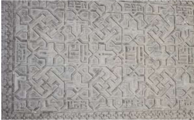
تصویر ۷- نوشتاری که در عین کثرت وارگی ساحتی واحد دارد. تزئینات روی ستون های ایوان مسجد جامع اصفهان.

جذابیت بصری خطوط خوشنویسی شده بر کتیبه های مساجد، در برابر دیدگاه بیننده و ذهن او نقش مفهومی فرازمینی و معانی نمادین برگرفته از ذات الهی را بیان می دارد. بنابراین "حروفی که در عین کثرت وارگی خویش، ساحتی واحد را تشکیل میدهند، امکان سیر معانی و مفاهیم معنوی را از صورت به معنا فراهم کرده و در ساختار صوری و باطنی خود، تداعی کننده رمز خلقت و حقیقت الهی می باشند." (احسنت؛ گودرزی سروش، ۱۳۹۶: ۱۲۱) استفاده از واژه هایی در کتیبه های بناهای اسلامی که نمایانگر وحدت در عین کثرت هستند. (تصویر ۷ و ۸)