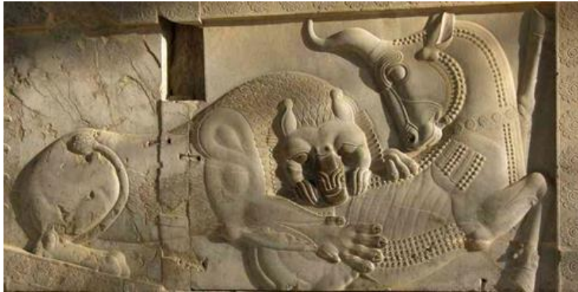
تصویر ۲: نبرد شیر و گاو. پلکان شرقی آپادانای تخت جمشید. نمادی از ستیز فصل‌ها. (هینلز، ۱۳۷۴: ۱۵۶)

گاو در ایران جنبه‌ی نمادین، آرمانی و عظمت دارد. در تمدن ایران گاو در حال مبارزه با دنیای مادی و رسیدن به دنیای معنوی است. به طور کلی، گاو در اساطیر ایران نماد باروری و باران است. گاو در ایران تجلی ایزدان است. این حیوان در ایران، منشاء پیدایش حیوانات و گیاهان، و شاخ‌های آن نماد ماه است.