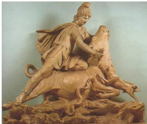
تصویر ۱: نقش برجسته حالات میترا در صحنه قربانی گاو در موزه بریتانیا.

"در آیین مهرپرستی ایران، میترا گاو نر را می‌کشد. کشتن گاو غالباً به معنی آفرینش تعبیر شده است. نیروهای خیر (که به صورت سگ مجسم شده‌اند) و نیروهای شر (که به صورت مار و کژدم مجسم گشته‌اند) بر سر چشمه‌ی حیات، یعنی خون و نطفه‌ی زندگی بخش گاو، می‌جنگد و سرانجام پیروزی خیر، محقق می‌گردد." (هینلز، ۱۳۸۱: ۱۲۵) (تصویر ۱)