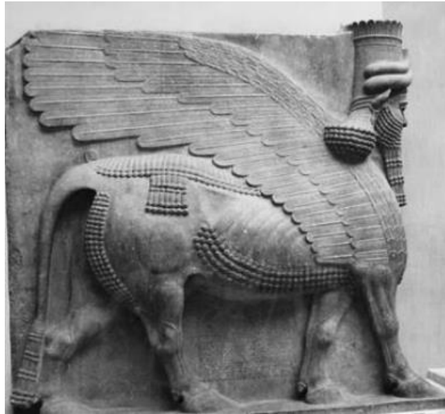
تصویر ۴: انسان - گاو بالدار.

هیكل متشخص گاو بالدار با سنگینی و وقار بی نظیرش بی اختیار بیننده را متوجه عظمت و اقتدار نامرئی حکومت شاهنشاهی می کند. گویا این نقش مشخص این حکومت جهانی عصر باستان است، در سنت های آیین زرتشتی، گاو علامت نخستین و برجسته قدرت بخشنده و مردم نواز روح جهانی است. (در اوستا گه واش اوروا و در پهلوی گاو یوداد (Geus - Urva - Gavyodad)