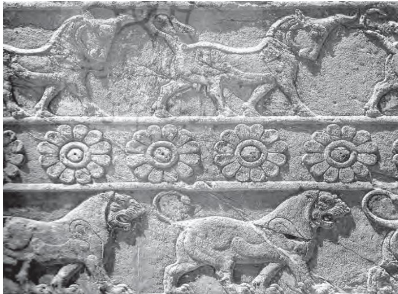
تصویر ۶: صف شیران و گاوان. تخت جمشید. از نقوش برجسته تخت جمشید، صفی از شیران و گاوان است که به دنبال هم ره می سپارند. (دویتز، ۱۳۷۷: ۸۲)

همانطور که گفته شد گاو در اساطیر کهن نماد قربانی کردن بوده است. قربانی کردن جانوران سنتی با ریشه های نمادین بود. در نقوش تخت جمشید تصویری از میترا، که گاو را قربانی کرده، سپس خوشه های گندمی را نشان می دهد که از خون گاو جوانه می زند (Ibid: 79). بنابراین می توان گفت گاو موجودی بی گناه بوده که برای تکامل دیگر موجودات قربانی می شود. در دوران باستان، بسیاری از ظروف میگساری و ریتون ها را به شکل سر گاو درست می کردند و بر این باور بودند که نیروی درون آن به کسی که آن را می نوشد، انتقال می یابد (Ibid: 80). گاو نخستین یکتا آفریده است. با این که این گاو موجودی بی آزار و زیبا قلمداد شده است اما در نهایت باید قربانی شود تا از خون و اعضای بدن او، دنیای نباتی و سپس دنیای جانوری خلق شود و حیات آغاز گردد. به همان شکل سیاوش نیز شخصیت مثبتی است که روح آزاده و جوانمردی دارد، مظلوم است و مظلومانه و بیگناه می میرد. اگر چه مرگ او باعث آغاز جنگ هایی دراز مدت بین دوسرزمین ایران و توران می شود و کینه توزی هایی به دنبال دارد اما در حقیقت با مرگ او به نوعی پیروزی ایرانیان رقم می خورد. از خون او گیاه مقدس خون سیاوشان می روید که با دنیای نباتی، خدایان شهید شونده عصر کشاورزی و رویش و زایش ارتباط دارد.