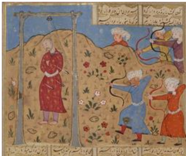
تصویر ۱. مزدک بر دار. شاهنامه طهماسبی. دوره صفوی

تصویر بالا از شاهنامه طهماسبی چگونگی به دار کشیدن مزدک را منعکس ساخته است. در این تصویر گروهی از نظامیان کمانها را به سمت مزدکی که به دار آویخته شده است، نشانه گرفته‌اند. این تصویر کاملاً منطبق با سخنان فردوسی در شاهنامه می‌باشد.