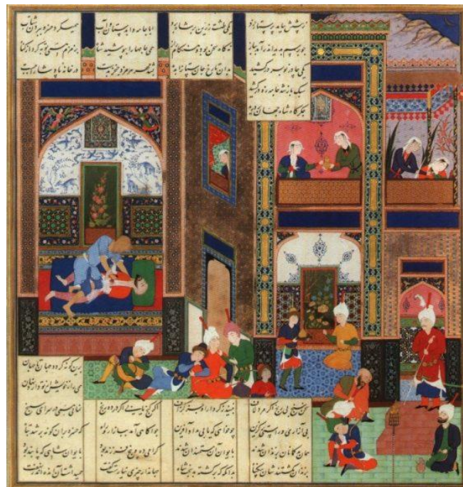
تصویر ۴. ماجرای توطئه قتل خسرو پرویز شاه ساسانی، شاهنامه شاه طهماسبی. دوره صفوی

فردوسی در دوران شاهی خسرو پرویز، بیشتر به مسائل شخصی خسرو مانند عشق وی به شیرین پرداخته و همچنین راجع به نوازندگان دربار نیز روایت‌هایی نقل شده که شبیه به داستان خسرو و شیرین نظامی است که نشان می‌دهد منابع مورد استفاده آن‌ها یکسان بوده و این داستان در کتاب‌ها نقل شده است. تصویر شماره ۴ به ترسیم ماجرای توطئه قتل خسرو پرویز پرداخته است.