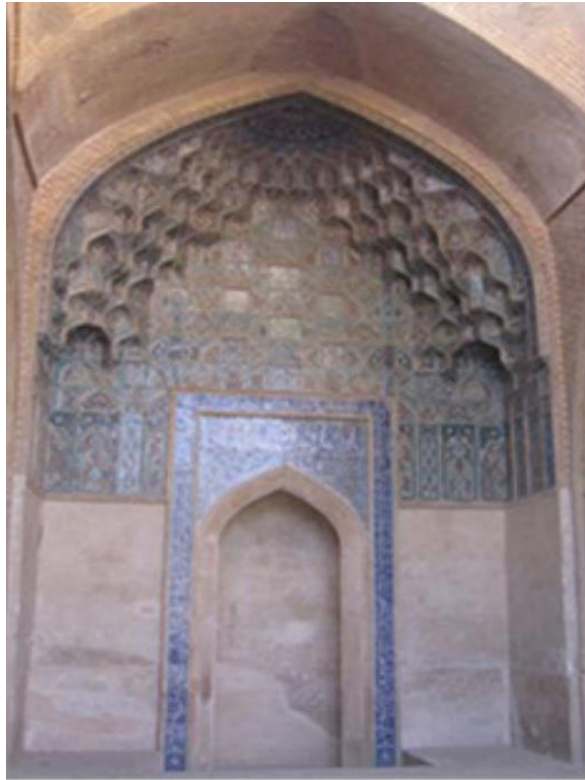
تصویر ۳- کتیبه سردر مسجد جامع اصفهان.

سردر جنوبی: در غرب گنبد خواجه نظام‌الملک یک در قدیمی دیگر وجود دارد که بر دو لنگه آن به خط ثلث بر زمینه لاجوردی «قال الله تبارک و تعالی و ان المساجد لله فلا تدعوا مع الله احدا» و آیه ۱۸ سوره جن حک شده است (جبل عاملی، ۱۳۹۱: ۴۴) نیز برخی آیات حک شده بر روی کاشی‌های تزئینی مسجد بوده است که به وسیله کاشی‌کاری، خطوط ثلث (علم‌بیگی، ۱۳۹۱: ۳۵) و مقرنس‌های آجری تزئین شده و صورت اصلی خود را حفظ کرده است. در این قسمت به وسیله خطوط کوفی کتیبه آیه ۱۸ و بخشی از آیه ۱۹ سوره آل عمران نوشته شده است. محراب ایوان شاگرد تماماً از سنگ مرمر ساخته شده و در دیوار جنوبی واقع شده است که آیه ۵۴ سوره مائده بر اطراف آن حک شده است. اطراف و بالای آن کتیبه‌ها و الواح مختلف حک شده است. اطراف محراب بر کاشی‌های کوچک به خط کوفی صلوات و درود بر چهارده معصوم حک شده، اما تنها شش لوح آن باقی مانده و مابقی مفقودند. دیوار شرقی که متعلق به ایوان کوچک واقع شده در ضلع شرقی ایوان شاگرد است، به وسیله خطوط گچ‌بری که در حاشیه آن انجام شده (اسماء‌الله، سوره حمد، اخلاص و آیه الكرسی نوشته شده است (پورنادری، ۱۳۹۴: ۱۳۰). متن اصلی که در صفه‌ای بزرگ گچ‌بری شده، شامل مربع و دایره‌های کوچک است که اسامی خداوند، نام محمد، ابوبکر، عمر، عثمان و علی در آن‌ها به خط کوفی حک شده است. در بعضی از دایره‌ها نام پیامبر و خلفای راشدین با هم نوشته شده و در بعضی دیگر عبارت «لا اله الا الله محمد رسول الله علی ولی الله» گچ‌بری شده است (همان).