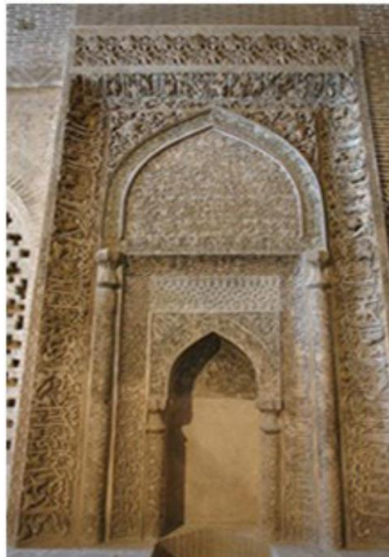
تصویر ۲- کتیبه محراب مسجد جامع اصفهان.

در دو طرف این مدخل، دو ستون سنگی و مرمری وجود دارد که شامل نقوش برجسته‌ای است و عبارات دعای نادعلی به خط ثلث بر آن نوشته شده‌است؛ ستون سمت راست: «ناد علیا مظهر العجائب تجده عوناً لک فی النوائب» ستون سمت چپ: «کل هم و غم سینجلی بولایتک یا علی یا علی یا علی» (نصرتی، ۱۳۸۰: ۲۹؛ هایده، ۱۳۸۰: ۳۳) سردر باب‌الدشت: سر در باب‌الدشت در انتهای راهرویی قرار دارد که قدمت آن به عهد سلجوقیان می‌رسد و در قسمت جنوب‌غربی مسجد قرار دارد و دارای چهلستون شاه‌عباسی، منبت‌کاری و طاق‌های آجری است. بر کتیبه سردر آیه ۱ تا ۳ سوره جمعه حک شده‌است. دو کتیبه دیگر نیز موجود است که آیه ۱۲۷ سوره بقره بر آن حک شده‌است (نصرتی، ۱۳۸۰: ۳۰؛ قاسمی سیجانی، قنبری شیخ شبانی، ۱۳۹۶: ۵۸).