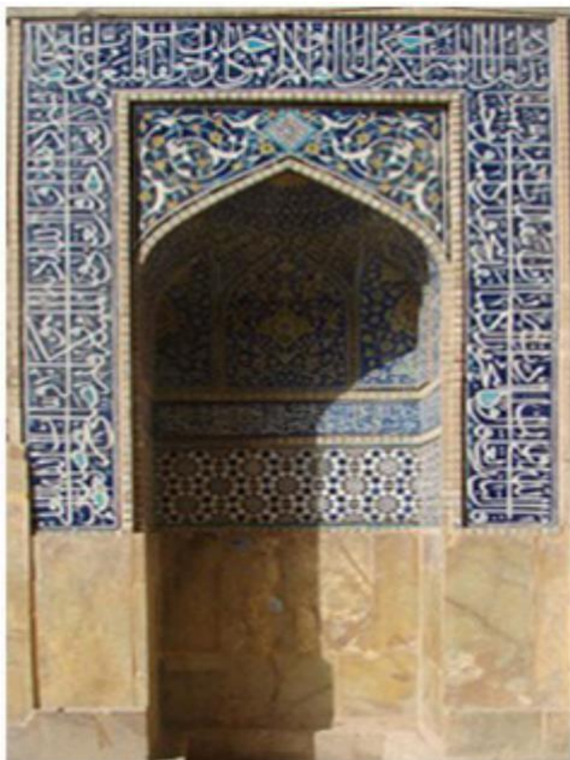
تصویر ۱- کتیبه قرآنی ورودی مسجد جامع اصفهان.

کتیبهٔ محراب شرقی شامل دو جزء می‌شود. در حاشیه (ان‌الله و ملائکه یصلون علی النبی یا ایها الذین آمنوا صلوا علیه و سلموا تسلیماً) حک شده و سپس صلوات بر دوازده امام همانند محراب غربی و در آخر هم سال اثر ۹۱۸ هـ ق نوشته شده است (قاسمی سیجانی، قنبری، شیخ شبانی، ۱۳۹۶: ۵۷).