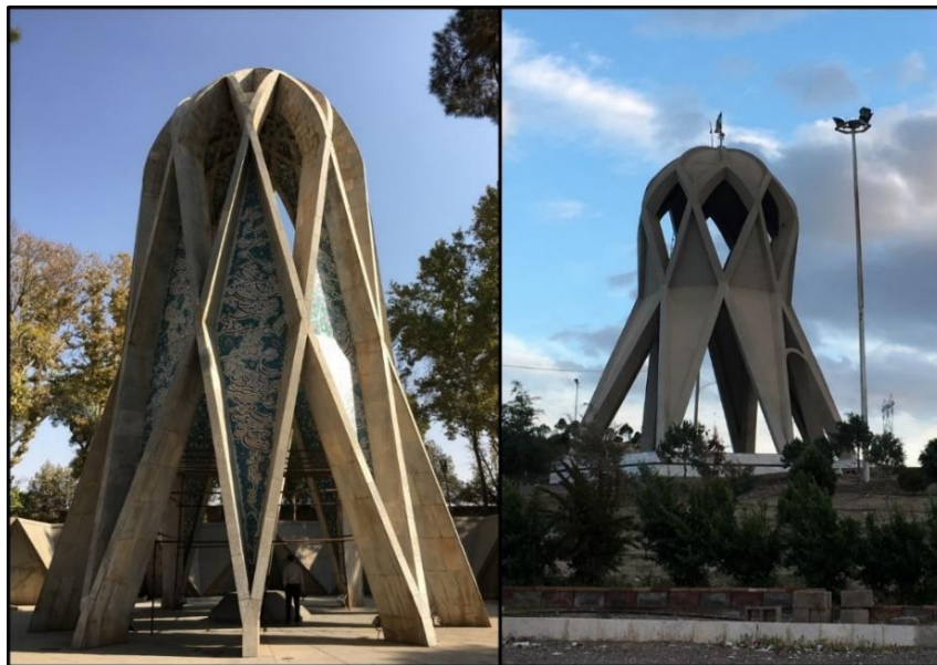
تصویر ۵: سمت راست مزار شهدای گمنام در سه راهی بیارجمند (جاده تهران-مشهد)، سمت چپ آرامگاه خیام نیشابوری در نیشابور

امروزه تقلید در امور هنری به امری شایع تبدیل شده است. این تقلیدها بعضاً از کارهای فاخر ایرانی و بیشتر از کارهای غربی است. «برای طراحی و ایجاد فضای شهری متناسب با تمدن ایرانی، به طراحی نو (و نه تقلید از بیگانگان) و به عبارتی، به روز آمد کردن تجارب و الگوهای تاریخی نیاز است» (نقی‌زاده، ۱۳۸۹: ۲۵). همان‌طور که تقلید از بیگانگان امری نامطلوب است، تقلید از آثار ایرانی نیز امری نامطلوب و بی‌ارزش است. همان‌گونه که در تصویر ۵ ملاحظه می‌شود، در جاده مشهد-تهران (سه راهی بیارجمند مابین شهرهای سبزوار و میامی) سازه‌ای دقیقاً کپی شده از آرامگاه خیام نیشابوری (واقع در شهر نیشابور)، ساخته شده است. این سازه‌ی تقلید شده برای کسانی که آرامگاه خیام نیشابوری را دیده‌اند، نه تنها جذابیتی ندارد بلکه دافعه هم دارد.