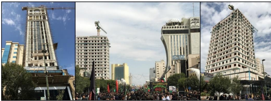
تصویر ۲: تدبیر مدیریت شهری در مورد خیابان امام رضا (ع) شهر مشهد

موضوع این است تقلیدهایی که از غرب صورت می‌گیرد، به صورت ناقص و منطبق بر فرهنگ مردم آنجا بوده است. این تقلیدها جوابگوی نیاز و فرهنگ شهروندان ایرانی نبوده و هر روزه مشکلات بیشتری را به مدیریت شهری تحمیل می‌کند. البته نباید فراموش کرد که همه نهادها و دستگاه‌ها در این کپی‌برداری‌ها سهیم هستند. «ما از تاریخ و فرهنگ خود بریدیم تا به فرهنگ غرب پیوند بخوریم ولی بی‌آنکه به این برسیم، از آنچه بودیم و داشتیم هم رانده شدیم. پیشرفت نمی‌تواند بریدگی و بی‌پیوندی باشد بلکه تداوم و تکراری است در سطحی بالاتر» (آشوری ۱۳۵۱: ۱۴۰ به نقل از پاکزاد، ۱۳۸۹: ۷۲). همان‌گونه که در تصاویر ۲ و ۳ مشاهده می‌شود مقایسه‌ای بین نحوه برخورد مدیریت شهری با خیابان هویت‌مند و اصلی شهر بین دو شهر مشهد و نیشابور صورت گرفته است. تصویر ۲، نحوه نگرش و سیاست مدیریت شهری در مورد خیابان امام رضا (ع) شهر مشهد را نشان می‌دهد که تنها با دید ارزش افزوده و موضوعات اقتصادی، هویت و شخصیت این خیابان که در سال ۱۳۵۵ به نحوه مطلوب و ایرانی-اسلامی طراحی و اجرا شده بود از بین رفته است.