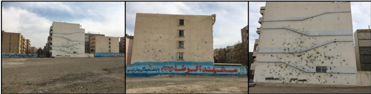
تصویر ۴: تناقض بین حقیقت و شعار و آثار آن بر کالبد منازل شهروندان

همان‌طور که در تصویر ۴ ملاحظه می‌گردد بر روی برخی از دیوارهای منازل خیابان‌ها، مدیریت شهری شهر مشهد را به عنوان پایتخت فرهنگی جهان اسلام مطرح نموده است. اما در مقابل شهروندان شاهد تنزل سطح اعتقادات و فرهنگ شهروندان در رعایت حقوق ساکنان این منازل هستند.