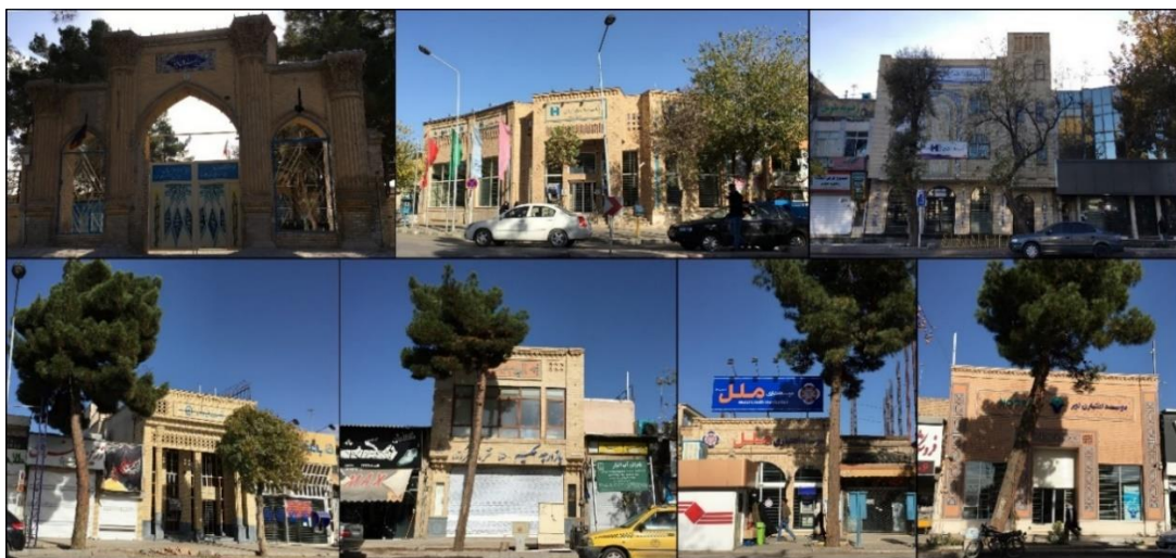
تصویر ۳: تدبیر مدیریت شهری در مورد خیابان امام خمینی شهر نیشابور

از سوی دیگر تصویر ۳ نشان‌دهنده برخورد مناسب مدیریت شهری در مقابل خیابان امام خمینی شهر نیشابور است. تنها دبیرستان خیام که عکس بالا سمت چپ است، قدیمی بوده و بقیه آثار در چند سال اخیر ساخته شده‌اند.