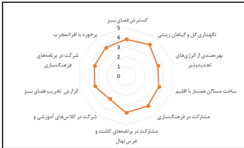
شکل شماره ۴: نمودار میانگین تمایل شهروندان