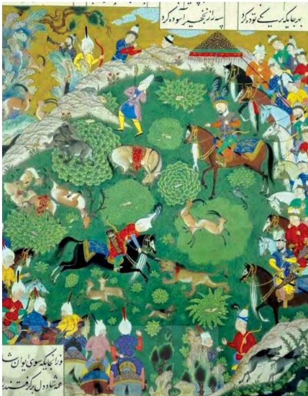
تصویر ۴- نگاره سیاه و سفید در شکارگاه، شاهنامه شاه طهماسبی.

انسان‌ها در طول سالیان متمادی از طبیعت به‌عنوان ابزار و بستر توسعه استفاده کرده‌اند اما توسعه بی‌مهار و بدون آینده‌نگری در سال‌های اخیر آثار مخربی بر طبیعت وارد کرده است. انتخاب همان روش‌ها از سوی کشورهای عقب‌مانده صنعتی برای توسعه به‌خاطر پایین بودن کیفیت تکنولوژی بر میزان آلودگی افزوده شده است. روش‌های موجود توسعه تهدیدی در جهت تغییر کره زمین است.