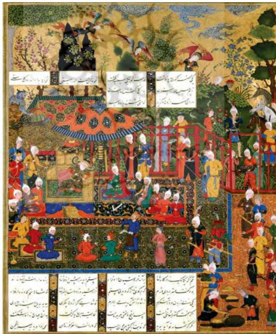
تصویر ۱: نگاره کاوه و ضحاک. منسوب به سلطان محمد.