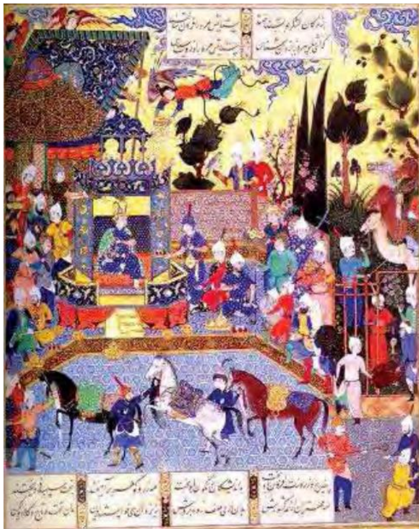
تصویر ۲- منوچهر در دربار فریدون.

این درحالیست که محیط‌زیست به‌عنوان بستر حیات اجتماعی انسان‌ها، در سالیان اخیر در معرض تخریب و تباهی‌های فراوانی قرار گرفته است. حقوق محیط‌زیست نیز به‌عنوان یک گرایش حقوقی نوپدید، به‌دنبال بهره‌گیری از ابزار حقوق برای پیشگیری و مبارزه با نابودی محیط‌زیست بشری است (مشهدی، ۱۳۹۴: ۹۴).