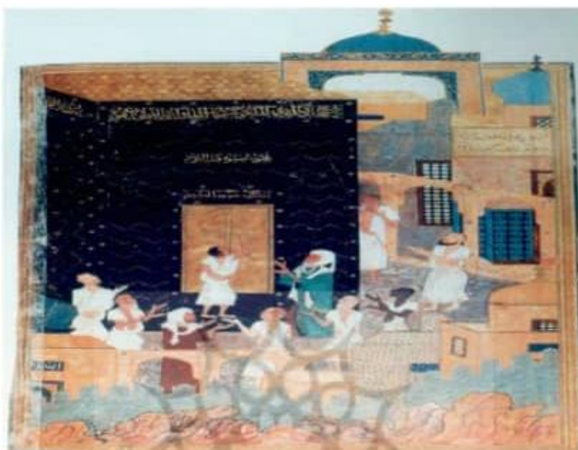
تصویر ۳: نگاره مجنون در طواف کعبه، از خمسه نظامی، سال ۸۹۶ ه.ق. منسوب به بهزاد. (مأخذ: شایسته‌فر: ۱۳۸۹).

یکی از مهم‌ترین راه‌های نزدیکی مذاهب اسلامی که به پایگاه عظیم وحدت مسلمانان جهان معروف است، فریضه حج است که می‌تواند نقش بسیار پررنگی در ایجاد یکپارچگی میان مسلمانان داشته باشد. حضور هم‌زمان همه ملت‌ها با تفاوت‌های نژادی، فرهنگی و ظاهری، زیر یک پرچم واحد در مکه و مدینه باعث شده که حج مظهر و فرصت واقعی وحدت اسلامی تلقی شود (شریفی، ۱۳۹۶: ۱).