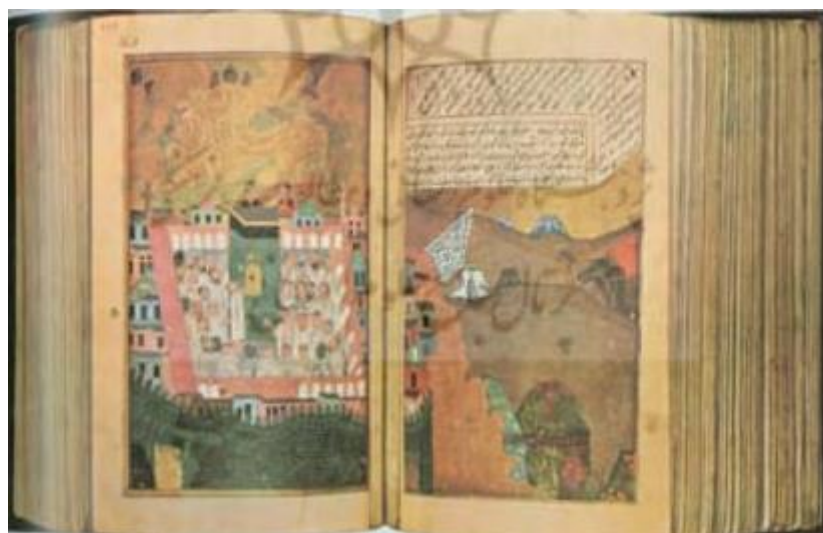
تصویر ۲: نگاره رفتن اسکندر به مکه، نسخه خطی جنگ اسکندر سلطان، سال ۸۱۲ ه.ق.

از نظر اجتماعی، حج باعث ارتباط جهانی مسلمین با یکدیگر می‌شود که سنت زیبایی در جهت اتحاد و ارتباط مسلمانان با یکدیگر است. از ویژگی‌ها و اهداف مهم حج این است که راه ارتباط بین ملت‌های مسلمان جهان را هموار می‌سازد؛ زیرا در مراسم حج از سراسر نقاط جهان مسلمانان به سوی حج می‌آیند و اجتماع یگانه‌ای را تشکیل می‌دهند و بدین وسیله اسلام بخشی از قدرت خود را در بین ادیان دیگر به نمایش می‌گذارد. در پرتو این عمل عبادی بزرگ، اتحاد مذهبی مسلمانان ایجاد می‌شود (مختاریان، اکبرزاده، ۱۳۹۹: ۶۰).