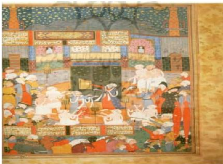
تصویر ۱: نگاره محرم شدن حاجیان، از کتاب شاهنامه قوام‌الدین، زیارت رفتن اسکندر دوره تیموری. مأخذ: (شایسته‌فر: ۱۳۸۹).

از نظر اجتماعی، حج باعث ارتباط جهانی مسلمین با یکدیگر می‌شود که سنت زیبایی در جهت اتحاد و ارتباط مسلمانان با یکدیگر است. از ویژگی‌ها و اهداف مهم حج این است که راه ارتباط بین ملت‌های مسلمان جهان را هموار می‌سازد؛ زیرا در مراسم حج از سراسر نقاط جهان مسلمانان به سوی حج می‌آیند و اجتماع یگانه‌ای را تشکیل می‌دهند و بدین وسیله اسلام بخشی از قدرت خود را در بین ادیان دیگر به نمایش می‌گذارد. در پرتو این عمل عبادی بزرگ، اتحاد مذهبی مسلمانان ایجاد می‌شود (مختاریان، اکبرزاده، ۱۳۹۹: ۶۰).