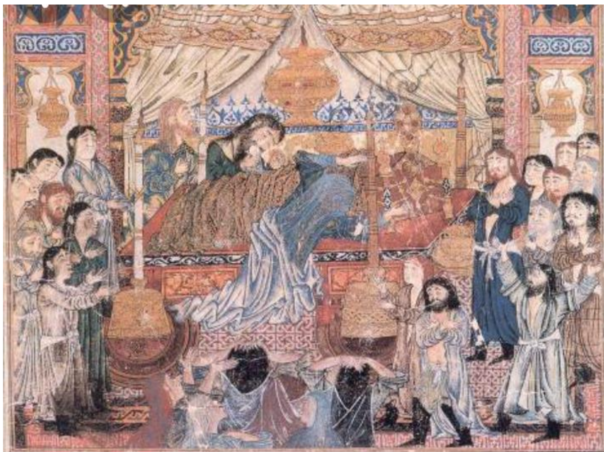
تصویر ۱: نگاره اعدام مانی، شاهنامه ابوسعیدی، قرن هفتم، دوره مغول، مکتب تبریز، مأخذ: (شیرازی، قاسمی: ۱۳۹۱)