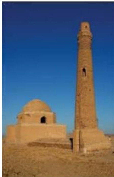
تصویر ۲: مقبره ارسلان جاذب و میل ایاز، مربوط به قرن چهارم هجری، دوره غزنوی. مأخذ: (اکبری و فرخی: ۱۳۹۶).

ابن بطوطه در سفرنامه خود به مجموعه تاریخی سنگ بست اشاره دارد که در را تلاقی مرو، نیشابور و قهستان و توس به عنوان یک بنای تجاری و نظامی ثبت شده است (ابن بطوطه: ۱۳۷۶: ۴۵۴)