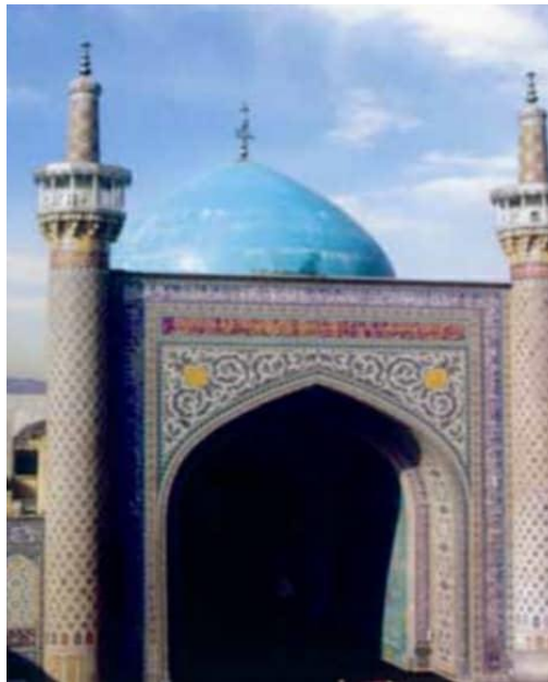
تصویر ۱: کلیات ایوان مقصوره، گلدسته‌ها و گنبد مسجد جامع گوهرشاد.

در قرن نهم هجری که مصادف با سلطنت تیموریان است، مشهد مقدس رضوی به صورت مرکزی دینی، فرهنگی، هنری و اقتصادی درآمد و مردم از اطراف و اکناف به آنجا می‌آمدند. شاهرخ امیر تیمور که در هرات حکومت می‌کرد، به مشهد مقدس عنایتی بسیار داشت. در این ایام به دلیل وجود امنیت، مردم از گوشه و کنار، برای زیارت به مشهد مشرف می‌شدند. در این دوره فضاهای جدیدی برای عبادت و زیارت ساخته می‌شد و در اختیار زائران حضرت رضا(ع) قرار می‌گرفت. گوهرشاد آغا رواق بزرگ دارالسیاده، رواق دارالحفاظ و رواق دارالسلام را ساخت و در همین زمان، مسجد مجلل و باشکوه گوهرشاد نیز بنا گردید (عطاردی، ۱۳۷۱: ۶۳۱-۶۳۰).