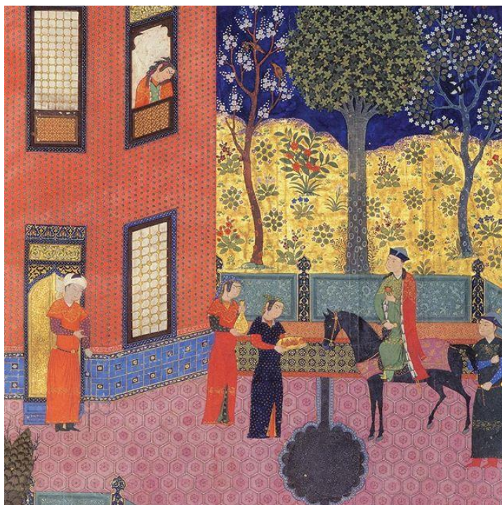
تصویر ۲: دیدار گلنار و اردشیر (شاهنامه بایسنقری)

ویژگی که در شخصیت گلنار ممتاز است بی‌پروایی در ابراز عشق است که تهمینه وار، به بالین مرد دلخواه خود می‌رود و عشق خود را به او اظهار می‌کند. معمولاً زنان در شاهنامه، آنجا که می‌دانند با ابراز عشق خود به مردی مردانه، کمترین غباری بر دامان زنانگی‌شان نمی‌نشیند، با گستاخی معصومانه‌ای، پا پیش می‌نهند و عشق خود را برملا می‌سازند. او به مردی با ویژگی‌هایی ممتاز ابراز عشق می‌کند و مرد نیز، قدر گوهر عشق او را می‌داند (حمیدیان، ۱۳۸۳: ۸۵۸). در مورد شخصیت گلنار، آنچه که در شاهنامه از این شخصیت بیان شده این است که این زن دانا به مرور جایگاهش را یافت، طوری که مشاور مالی و وزیر شاه شد و کلید خزانه‌ی اردوان در دستان او قرار گرفت. در نگاره دیدار گلنار و اردشیر مصور شده در شاهنامه بایسنقری، تمایل جهت سر به سمت پایین در تصویر گلنار به نوعی مبین این مطلب است که نگارگر سعی داشته است که این خضوع و کنیزک صفتی شخصیت گلنار از نگاه فردوسی را نشان دهد (تصویر ۲).