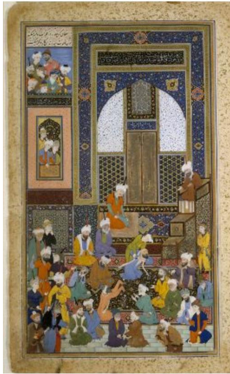
تصویر ۲: نگاره افشاگری در مسجد، دیوان حافظ، مرکزی بین‌المللی میکروفیلم نور.