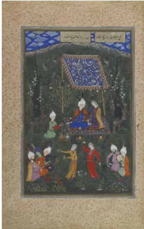
تصویر ۱: نگاره بزم عاشقان، دیوان مصور حافظ، مرکز بین‌المللی میکرو فیلم نور.

این تعابیر را می‌توان در نگاره‌های مصور دیوان حافظ نیز مشاهده کرد. تصویر ۱، به دیدار عاشقان اشاره دارد.