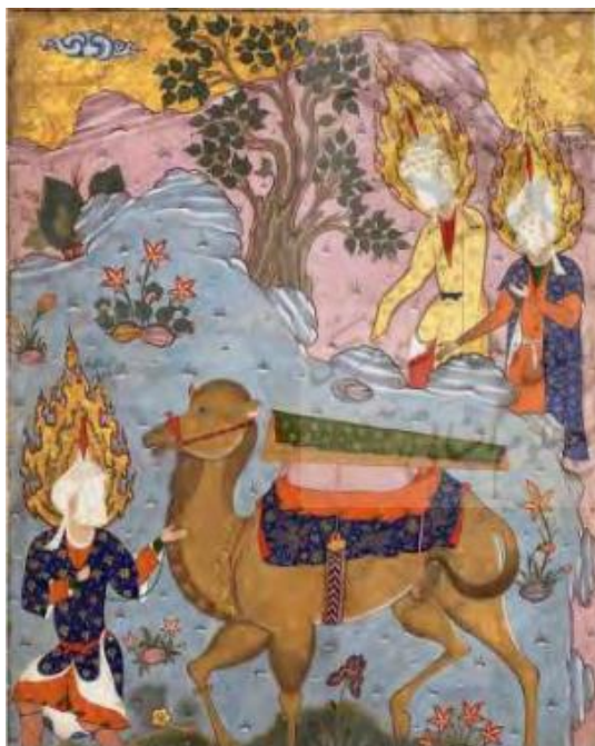
تصویر ۱. تابوت حضرت علی (ع). فالنامه طهماسبی، مکتب قزوین. محل نگهداری: موزه متروپولین

به موازات پرداختن به مفهوم مرگ در نگاره های ان مکتب به مفهوم زندگی نیز پرداخته شده است. تصویر شماره ۲ به ترسیم کشتی نوح، به نوعی تداوم زندگی و امید را ترسیم کرده است.