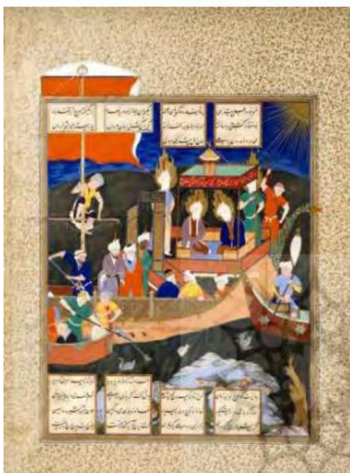
تصویر ۲. نگاره کشتی نوح شاهنامه طهماسبی. مکتب قزوین. محل نگهداری: موزه متروپولین

به موازات پرداختن به مفهوم مرگ در نگاره های ان مکتب به مفهوم زندگی نیز پرداخته شده است. تصویر شماره ۲ به ترسیم کشتی نوح، به نوعی تداوم زندگی و امید را ترسیم کرده است.