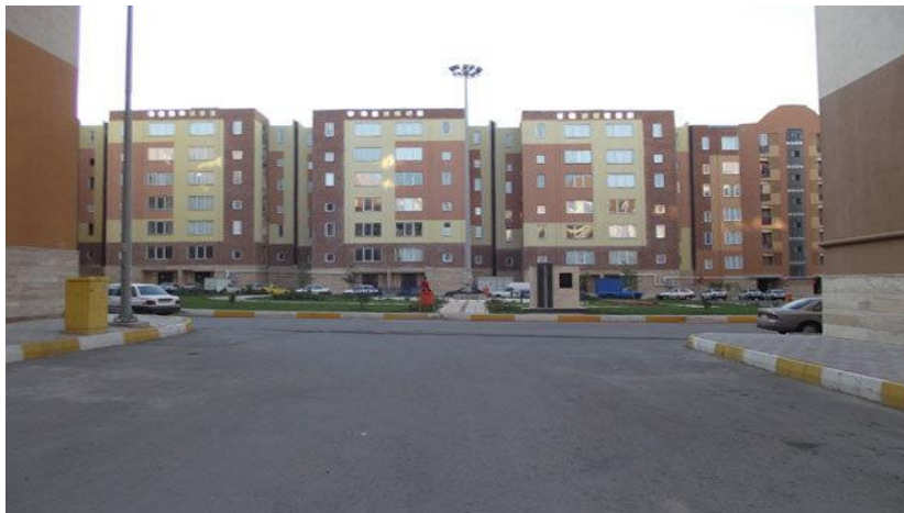
عکس شماره ۱. موقعیت محلات شهر جدید بهارستان.