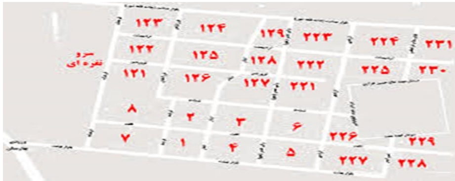
نقشه شماره ۱. موقعیت محلات شهر جدید بهارستان

این شهر از نظر ساختار جمعیتی دارای شاخصه‌های خاص خود است. در جدول شماره ۲ این مختصات جمعیتی به تفکیک بیان شده است.