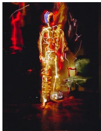
تصویر ۶: عکاسی از پیت اکرت. منبع (نگارنده)

در واقع در عکاسی پست مدرن مخصوصاً در نقاشی با نور که شیوه‌ای از عکاسی است که با سرعت‌های پایین، شاتر دوربین و حرکت منبع نوری به عنوان سوژه صورت می‌گیرد (اردلانی، ۱۳۹۷: ۸۱)، نیرو و احساس بخش مهمی از خلق اثر هنری است که در جریان عکاسی نقاشی با نور تأثیر مهمی دارد. فرد نابینا با استفاده از بهره‌های نوری و جریان احساس سیال، سیروورت در اثر را پایدار می‌کند.