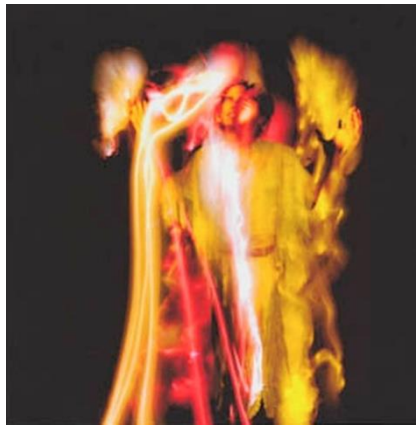
تصویر ۵: عکاسی از پیت اکرت. منبع (نگارنده)

تصویر (۵) تأثیری از یک احساس جاری در هنر عکاسی است که پیت اکرت با در نظر گرفتن ابعاد حسی اثر ساختار را در هم شکسته و در قالب یک اثر هنری آن را به نمایش درآورده است. یک عکاس نابینا تنها با جریان احساس و بهره‌گیری از نیرو، سیروورت را در این عکس به خوبی نشان داده است.