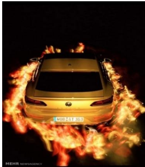
تصویر ۱: عکاسی از پیت اکرت. منبع (نگارنده)

ساختار تعریف شده در جسم ما را به این ضعف می‌رساند که برای تصویرسازی نیاز به دیدن از طریق چشم داریم اما وقتی فلسفه بدن دلوز را در نظر بگیریم می‌توانیم احساس را به عنوان یک چشم در نظر بگیریم و ساختار را تغییر داده و به خلق اثر هنری دست بیاویزیم. در عکس‌های متعلق به پیت اکرت می‌توان توانایی عملکردی خلق اثر هنری بدون یک یک جسم کامل را دریافت. هنر می‌تواند در احساس هنر و مخاطب و کسی که خلقش می‌کند جریان داشته باشد. همان‌طور که دلوز در فلسفه بدن بدون اندام اشاره می‌کند، نظم می‌تواند در بی‌نظمی خود را نشان داده و تکامل می‌تواند به صورت تکه پاره باشد یا از هم گسیخته به مانند ریزوم که یک مثال طبیعی در این باره است. هنرمندانی که تفاوت ماهوی رویت انسان و ثبت مکانیکی دوربین را تشخیص دادند، نه فقط در پی عکاسی به راه تقلید محض از طبیعت نیفتادند، بلکه در تحول این فکر کوشیدند که هنر چیزی بیش از ثبت دنیایی مرئی است (اردلانی، ۱۳۹۷: ۶۴). در عکاسی‌های پیت اکرت احساس نقش یک مولد را بازی می‌کند که از طریق بی‌سازمانی، آفرینش را رقم می‌زند.