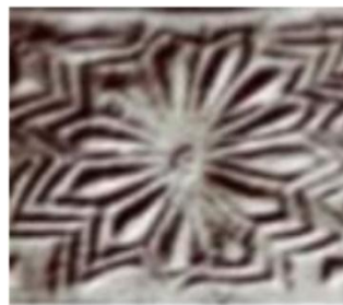
تصویر ۲. نقش شمس بر مهرهای شوش.

آریایی‌ها مشاهدات خود را از طبیعت به زبان استعاری تشریح می‌کردند و به‌جای این‌که بگویند شب فرا رسیده است می‌گفتند: سلنه (ایزد بانوی ماه) با بوسه‌اندومیون (خورشید) گرفتار خوابی جاودانه شد و هماره جوان ماند. اقوام آریایی وقتی کوچیدند، استعاره‌های خود را به اروپا منتقل کردند (روتون به نقل از اصغریان و رستمی، ۱۳۹۸: ۳۰). آپولو با موهای طلایی و چشمان آبی و با تونیک از جنس پوست پلنگ و کمان زرین و تیرهای طلایی و اسبان سفید رنگ، خدای خورشید بود (اوسلین به نقل از اصغریان و رستمی، ۱۳۹۸: ۳۰). در آشور باستان، بر روی سنگ قبر مردگان، چلیپایی با نقش خورشید می‌گذاشتند تا مردگانشان در خوشبختی و نیک‌فرجامی زندگی ابدی را سپری نمایند (رک: بختورتاش، ۱۳۸۰). تصویر شماره ۲ نقش شمس را در مهرهای شوش نشان می‌دهد.