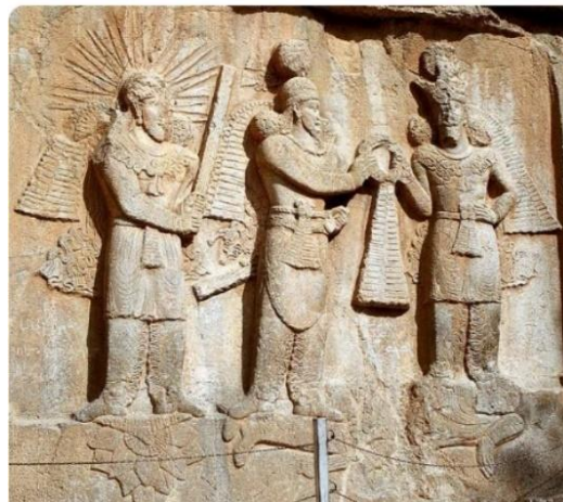
تصویر ۲. نقوش دوره باستان در طاق بستان. کرمانشاه

در یکی از نقش‌های برجسته طاق‌بستان سه شخص مشاهده می‌شود که یکی از آن‌ها هاله‌ای از پرتوهای خورشید بر دور سر دارد و بر روی نیلوفری ایستاده است. پروفیسور گیرشمن آن را میترا نامیده است (رک: گیرشمن، ۱۳۷۰: ۱۹۰). تصویر شماره ۳ این نقش را نشان می‌دهد.