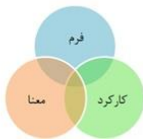
نمودار ۲. مقوله‌های مؤثر در طراحی معماری (نگارنده)

گروتر درباره انواع نشانه‌ها و منبعث از آن اشاره می‌کند. نشانه‌ها در معماری دارای ساختارهای متعددی هستند که عبارت‌اند از: ۱- نقش‌ها ۲- شکل معماری ۳- علامت روشن ۴- استعاره ۵- نماد. درباره نمادها معتقد است که به دو نوع باواسطه و بی‌واسطه دسته‌بندی می‌شوند. در این میان نقش‌ها دارای ویژگی‌های متعددی در معماری هستند که عبارت‌اند از فرم، اندازه، رنگ و همواره به‌عنوان یک علامت ظاهری به کار می‌روند. درباره شکل معماری باید اذعان کرد که گویای مفهوم و محتوای، نشانه گفتگو و از روابط بین علامت و محتوا پدید می‌آید. در رابطه با علامت روشن برای درک آن نیز به دانش قبلی در این زمینه داریم. در رابطه با استعاره باید گفت تطابق تجربیات با شکل، تابع شخص بیننده و محیط فرهنگی بیننده است که براساس تجربیات خود معمار را وادار به طراحی بهتر فرم و شکل می‌کند که می‌تواند شکل فضای داخلی و خارجی را با آن هماهنگ کند. درباره نمادها باید گفت بیانگر محتوای ذهنی، احتیاج به شناخت قبلی برای درک آن و وابسته به فرهنگ هستند (Grutter, 2010, pp. 501-523).