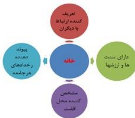
نمودار ۱. مفهوم خانه (نگارنده)

اغلب نظریه‌پردازان حوزه معماری بر این باورند که فرهنگ یکی از عوامل مؤثر در طراحی خانه است. پیکره‌بندی فضایی خانه در یک منطقه فرهنگ ساکنان را حمایت یا مختل نماید. از این رو شکل خانه در معماری بومی بیان درک محتوای زندگی است (بازایی و همکاران، ۱۳۹۹: ۱). خانه هویت خود را دارد، ارتباط با دیگران را تعریف می‌کند و تداوم سنن و ارزش‌ها را در خود جای می‌دهد. خانه بسیار گسترده است و می‌تواند مکانی خاص، محل اقامت، یک ساختمان، محله، شهر یا یک کشور باشد که حس‌ها، صداها، رایحه‌ها و رخدادها هر جامعه و زندگی‌ها را به هم پیوند می‌دهد. جایی که ما با بودن در آن تصور می‌کنیم دنیا در آینده نیز همان‌گونه خواهد بود که در گذشته بوده است (امین‌زاده، ۱۳۹۴: ۱۱۱).