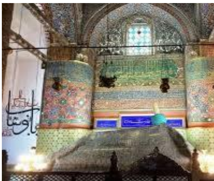
تصویر ۱. تزئینات کتیبه‌ای و رنگ‌ها در مقبره مولانا در قوینه.

قطب جهانی، همه را رو به توست جز که به گرد تو دواریم نیست خویش من آنست که از عشق زاد خویشتر از این خویش و تباریم نیست چیست فزون از دو جهان؟ شهر عشق بهرتر از این شهر و دیاریم نیست (همان: غزل ۵۰۶)