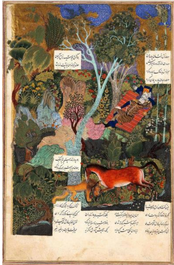
تصویر ۱: نگاره رستم خفته و رزم رخس رستم با شیر، اثر سلطان محمد، شاهنامه فردوسی، موزه بریتانیا.

یکی از ویژگی‌های بارز شعر معاصر عربی و فارسی، تکرار است. تکرار در موسیقایی کردن شعر، نقش اساسی دارد و به انواع مختلف تکرار واکه (مصوت)، واج (همخوان یا صامت)، کلمه و عبارات تقسیم می‌شود. «ما شهرها را می‌سازیم، نه اینکه آن‌ها ما را بسازند/ ما آن‌ها را بر سر راهمان پدید می‌آوریم، نه اینکه آن‌ها ما را پدید آورند/ ما همان کسانی هستیم که شهرها را نامگذاری می‌کنیم/ و محدوده آن‌ها را مشخص می‌سازیم.» (الصباح، ۲۰۰۶: ۲۶۴). سعدالصباح در این مقطع کوتاه از شعرش هجده بار صامت «نون» را تکرار کرده تا میزان تنفر خود را از شهرها نشان دهد. تکرار صامت «نون» در کنار فعل‌های مضارع استمرار، تنفر و همیشگی بودن این بیزاری را به مخاطب القا می‌کند. ما در زبان فارسی ۶ واکه و ۲۳ تا هم همخوان داریم. این نوع از تکرار، در سروده‌های ژاله اصفهانی هم فراوان یافت می‌شود. در بند زیر، مصوت بلند «الف» و مصوت کوتاه «ا» تکرار شده است تا علاوه بر ادا کردن کارکرد موسیقایی خود، مفهوم مدنظر شاعر را نیز به مخاطب القا کند: «دختر کوچک ناز/ همه شب‌های دراز/ دست در گردن مادر می‌کرد/ بوسه بر چهره‌ی مادر می‌زد/ قصه‌ی تازه ز مادر می‌خواست/ قصه‌ها را همه باور می‌کرد. / قصه‌ها، سرزمین‌های طلایی شگفت.» (اصفهانی، ۱۳۸۴: ۲۳۸).