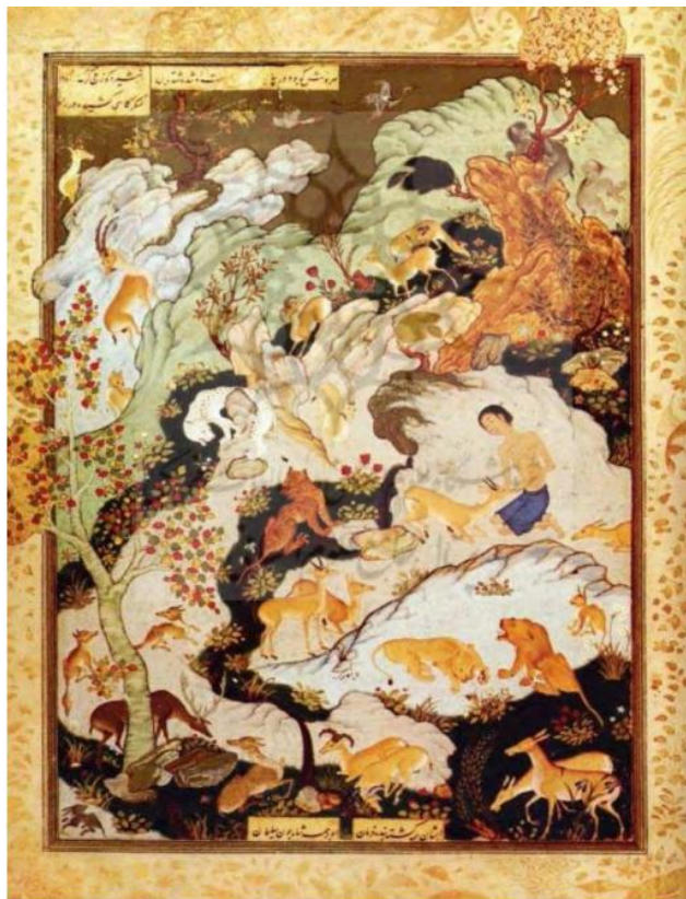
تصویر ۳: مجنون در بیابان، خمسه طهماسبی، منسوب به آقا میرک، دوره صفوی، کتابخانه موزه بریتانیا، لندن (اژند: ۱۳۸۴)

اولین عامل خلق تصویر در مباحث بیانی و اساسی‌ترین ابزار زیبایی کلام، تشبیه است. «تشبیه یکی از ترفندهای زیبایی‌آفرینی در شعر و نثر است. مقوله تشبیه در ادبیات‌شناسی سنتی ضمن علم بیان قرار می‌گیرد و آن را همراه با استعاره، مهم‌ترین عناصر شعر دانسته‌اند» (شفیعی کدکنی، ۱۳۶۶: ۶۷). «من یا تری یزرعنی...؟ / کنجمة زرقاء فی السماء... / من یا تری یطلقنی عصفورة... / فطالما حلمت آن أطیر فی الفضاء... / حریتی ... اسم بلا مسمی... / و خیمتی مختومة بالشمع... / لا یدخلها الحب... / و لا یدخلها الهواء (الصباح، ۲۰۰۷: ۱۸۶). «راستی چه کسی من را می‌کارد؟ همچون ستاره‌آبی در آسمان... چه کسی مرا آزاد می‌کند همچون گنجشک... آزادی‌ام اسمی است که مسما ندارد و خیمه‌ام با شمع مهروموم شده نه عشق وارد آن می‌شود و نه هوا». انسان آزاد به دنیا آمده است، از این‌رو باید آزادی خود را در طبیعت و جامعه تجربه کرده و شخصاً بر سرنوشت خویش حاکم شود. همواره یکی از موضوعات اساسی ادبیات آزادی‌خواهی بوده و دغدغه اکثر زنان شاعر است. سعاد الصباح نیز با تشبیه آزادی به عربی اسمی بدون مسما تشبیه زیبایی را خلق کرده است. در نگارگری ایرانی نیز شاهد کاربست تشبیه هستیم. در تصویر شماره ۳، اندوه به رنگ زرد ترسیم شده است.