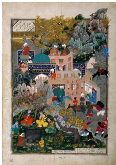
تصویر ۲: نگاره داستان هفتواد و سرگذشت کرم، دوست محمد، شاهنامه فردوسی، دوره صفوی، ۹۴۶ه.ق. مأخذ: (هوشمند منفرد: ۱۳۹۶)

۱. در مباحث فلسفی مبانی زیبایی شناسی آمده است به خصوص در صنعت شعر که ابن سینا و سهروردی این مبحث را ادامه داده اند؛ ۲. ابن سینا و سهروردی در فلسفه و حکمت خودشان مباحثی دارند مانند عالم خیال، عالم معلقه، نور، ظلمت و تجلی که از اینها می توان این بحث ها را استخراج کرد؛ ۳. این دو فیلسوف بزرگ شرقی یعنی ابن سینا و سهروردی هنرمند بودند و تمثیل های عرفانی زیبا می نوشتند که آثار هنری هستند. سهروردی ده رساله دارد مانند عقل سرخ، آواز پر جبرئیل و... که آثار ادبی هستند. اگر هنر را از منظر ایشان در نظر بگیریم، ادبیات هم در موزه هنر می گنجد. این دو فیلسوف در کتاب هایشان نظریاتی را درباره هنر داده اند؛ به عنوان مثال، ابن سینا در رساله حی بن یقضان و سهروردی در رسالات فی حقیقه العشق نشان می دهد که زیبایی و حسن چگونه وارد عالم می شود و این را در قالب قصه یوسف و زلیخا نشان داده است. ابن سینا و سهروردی تنها کسانی نبودند که به تحقیق یا استحال روحی موفق شده و به این تجربه های روحانی عقیده داشته یا به آن قائل بوده اند؛ اما از جمله کسانی هستند که موفق شده اند آنچه را که به ذوق یا در طی تجربیات روحانی دریافته و مشاهده کرده اند و با تخیل فعال مرتبط با عقل آنان در چشم انداز روحشان آمده اند، در قفس ضرورت داستان های رمزی اسیر کنند و لحظه های شگفت روحانی و غیر بیان خوش را در قالب رمزها و مثال های شخصی خود در معرض تماشای ما قرار دهند (پورنامداریان، ۱۳۶۴: ۲۸۲).