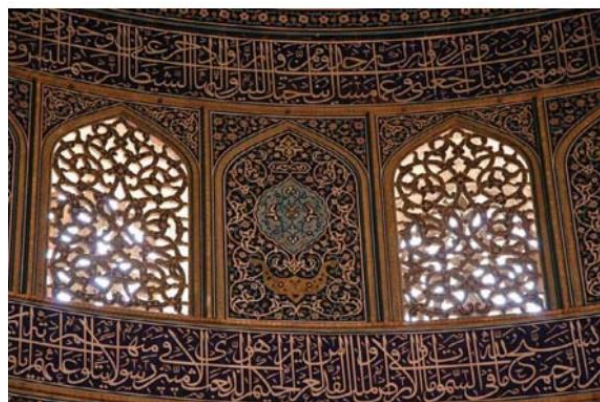
تصویر ۴: فضا سازی نور در معماری مسجد شیخ لطف‌الله اصفهان. دوره صفوی.

در تصویر ۳، با ایجاد نوعی وحدت و زیبایی در گنبدخانه در حقیقت جمال و زیبایی ازلی پروردگار به نمایش گذاشته می‌شود. مابعدالطبیعه و جهان‌شناسی سهروردی پس‌زمینه‌ای برای نوعی زیبایی‌شناسی است که زیبایی را با نور و نور را با خود وجود یکی می‌داند. جهان، اول از همه مشتمل بر سلسله طولی انوار است که مراتب آن به درجات شدت و ضعف نور و ظلمت از یکدیگر متمایز شده‌اند. خود این درجات چیزی جز نور یا فقدان نور نیست.