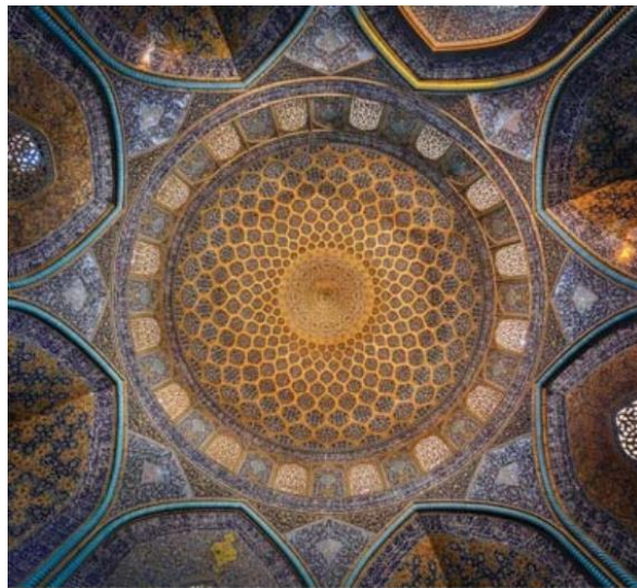
تصویر ۳: گنبدخانه مسجد شیخ لطف‌الله اصفهان، دوره صفوی.

از نظر ابن سینا، واجب الوجود مبداء همه زیبایی‌های موجود در عالم هستی است. «فالواجب الوجود هم الجمال و البالمحظ و هو مبداء کل اعتدال». از نظر ابن سینا دوست داشتن و مرتبه شدید آن یعنی عشق از جمله عوارض زیبایی بر مدرک و ادراک کننده است «کل جمال و خیر مدرک فهو محبوب و معشوق». لذت بخشی اثر دیگر زیبایی بر مدرک است که تعریف می‌شود به ادراک ملائم از آن جهت که ملائم است. تصویر شماره ۲، نیز با کاربری رنگ‌های زیبا و ایجاد فضای چشم‌نواز، تأییدی بر اصل زیبایی عینی و اهمیت آن در هنرهای عصر صفوی است.