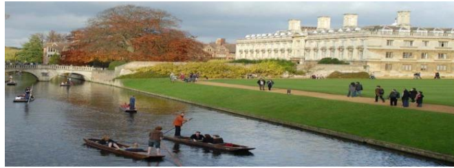
تصویر ۱. دانشگاه کمبریج که مردم در حال استفاده از فضای پردیس می‌باشند.