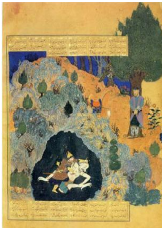
تصویر ۳. نگاره نبرد رستم و دیو. شاهنامه بایسنقری. مکتب هرات. دوره تیموری. محل نگهداری: کاخ موزه گلستان

دیو در اوستایی دَئَو (dava) نامیده می‌شود و در اصل به معنی خدا است. این واژه در قدیم به گروهی از خدایان آریایی اطلاق می‌شد ولی پس از ظهور زرتشت و معرفی اهورامزدا خدایان قدیم (دیوان)، همراه‌کننده و شیاطین نامیده شدند (یاحقی، ۱۳۸۶: ۳۷۱). در اوستا نیز دیوان را خدایان باطل و گروه شیطان معرفی کرده است. در این شعر، شاعر با استعاره‌ای از مرگ سخن می‌گوید که به او نگاهش را بسته و منتظر او است. تصویر شماره ۳ انعکاس وجود دیو در شاهنامه مصور دوره تیموری را نشان می‌دهد.