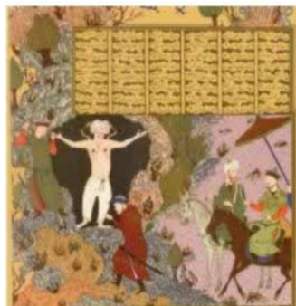
تصویر ۱. نگاره به بند کشیده ضحاک. شاهنامه بایسنقری. مکتب هرات. دوره تیموری. محل نگهداری: کاخ موزه گلستان

در این شعر، شاعر با ایهام در آهنگر، اشاره‌ای به کاوه آهنگر در شاهنامه می‌کند و از مردم می‌خواهد همانند کاوه که با قیام مردمی خود توانست ضحاک را بعد از هزار سال استبداد از تخت به زیر بکشد و فریدون را به تخت بنشاند، در برابر ظلم مقاومت کنند و ظلم را بکوبند. در نسخه مصور شاهنامه بایسنقری متعلق به دوره تیموری نیز نگاره‌ای از این روایت آمده است. تصویر زیر به بند کشیدن ضحاک را نشان می‌دهد.