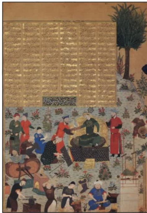
تصویر ۲. نگاره پادشاهی جمشید. شاهنامه بایسنقری. مکتب هرات. دوره تیموری. محل نگهداری: کاخ موزه گلستان

در نسخه مصور شاهنامه بایسنقری متعلق به دوره تیموری نیز نگاره از شاهان اساطیری منعکس شده است. تصویر زیر یک نگاره متعلق به جمشید است.