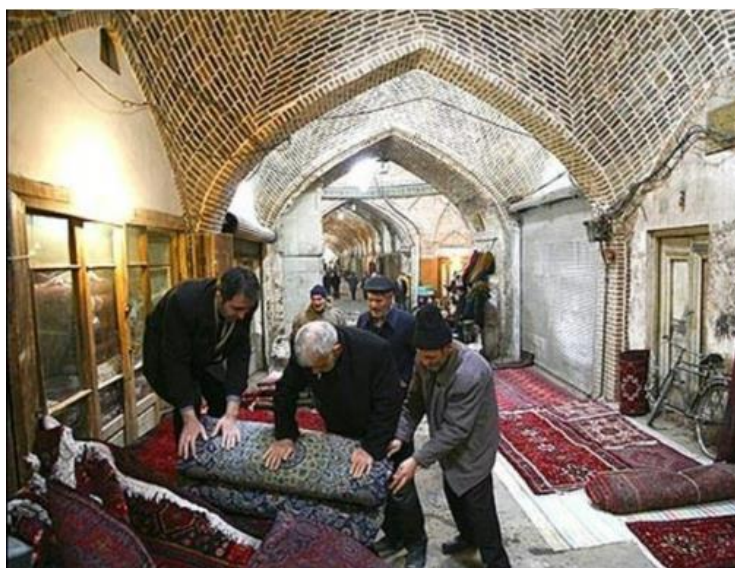
تصویر ۲: نمایی از درون بازار سنتی کرمانشاه، مأخذ: (مرادی و همکاران، ۲۰۱۶).

بنای تاریخی و استفاده از المان‌ها و نشانه‌های سنتی، به نوعی یادآور گذشته‌ای است که به باور بسیاری از ایرانی‌ها امروزه، رنگ باخته است و دیگر نشانی از آن قدرت و بزرگی و شکوه نمی‌بینند. بسیاری از معماری‌هایی که در دوره گذشته و قبل از انقلاب ساخته شده‌اند، همگی سعی بر بازنمایی این گذشته داشته‌اند و از این بناها الگو گرفته‌اند. یکی از توفیقات چنین فضاهایی در جلب توجه بازدیدکنندگان، حفظ اصالت و فرهنگ و پیدا کردن هویت گم‌شده‌ای است که دیگر نشانی از آن نمی‌بینند. از افراد آنچنان لذت‌بخش است که جز جز این مجموعه برای شان حکایت از داستان نقشه‌کش قابلی است که همه چیز را به تناسب در کنار هم قرار داده است. این همخوانی و هم‌نوایی بین عناصر و اجزای مختلف بنا از یک سو و طبیعت بیرونی از سوی دیگر، چنان باعث انبساط خاطر می‌شود که می‌تواند چشمان هر فردی را مبهوت خود کند. تصویر شماره (۲) می‌تواند تصویرگر عناصر تأثیرگذار بر شور و احساسات بازدیدکنندگان از بازار باشد.