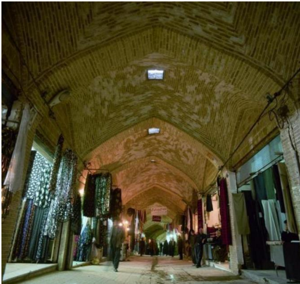
تصویر ۱: نمایی از دلان اصلی بازار سنتی کرمانشاه، مأخذ: (مرادی و همکاران، ۲۰۱۶).

احساسات، یکی از مهمترین مؤلفه‌هایی است که همه بازدیدکنندگان برای ارتباط برقرار کردن با چنین فضایی بیان کرده‌اند و بر این عقیده‌اند، که راه فهم و آمدن به چنین مکانی، کانال احساس و عواطف است که در خوانش آنها از این مکان بسیار مهم است. راه درگیر شدن آنها با بنا و ماندن در محیط، پابند کردن احساسات آنها در این فضا است. شاید بتوان گفت که آرامش و احساسات خوبی که افراد از محیط بازار می‌گرفتند، دلیلی برای برگشتن و یا ترک کردن، آن محل است. این احساسات است که حلقه رابطه انسان و محیط می‌شود و تأثیری که این محیط در عمق وجود فرد به جای می‌گذارد، به مراتب از منطق و تحلیل، بالاتر است. تصویر شماره (۱) نمایی از بازار سنتی کرمانشاه را منعکس ساخته که بدون تردید نخسته ویژگی کالبدی آن تلقین حس امنیت است.