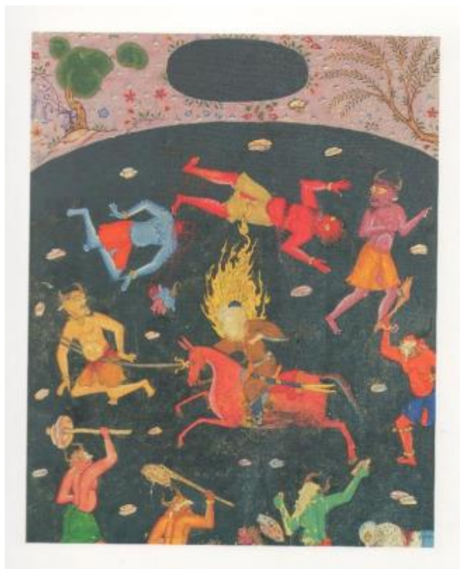
تصویر ۱: مُسخر کردن اجنه توسط امیرالمؤمنین علی(ع)، هنرمند نامعلوم، احسن الکبار، ۹۸۸ ه.ق.

رنگ قرمز تند تن اجنبه در جنگ با امیرالمؤمنین علی(ع) در احسن الکبار در نگارگری استفاده شده است. در نگارگری ایرانی در کاربرد نور و نار از رنگ‌های درخشنده، شفاف، براق، سیال، موج و جاری (همچون خیال) برای جلوه‌گری نور و از رنگ‌های غلیظ و شدید برای بیان جلوه‌های ناری استفاده شده است. تصویر ۱ این موضوع قابل مشاهده است.