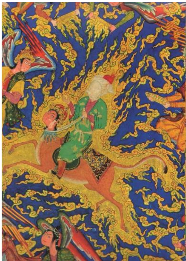
تصویر ۲: معراج پیامبر، خمسه نظامی، ۹۵۶ ه.ق، هنرمند نامعلوم.

آتش نماد روحانیت و نورانیت انبیا و اولیاست و نشان می‌دهد آتش این آثار، رنگی سرخ و متمایل به سیاه ندارد؛ بلکه کاملاً طلایی و شفاف است. در نگاره شماره ۲، آتشی که از سر انبیا زبانه می‌کشد، نشان‌دهنده تقدس و روحانیت ملکوتی است.