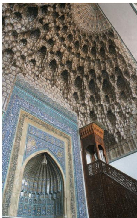
تصویر ۴: محراب مسجد گوهرشاد، قرن نهم، دوره تیموری، مأخذ: (شفیعی و همکاران، ۱۳۹۳: ۳۷).

با این تفاسیر، اندیشه‌های قرآنی که در عرفان اسلامی نیز منعکس شده است، به‌وفور در آثار هنری اسلامی از نظر ساختار و تزئینات قابل مشاهده است.