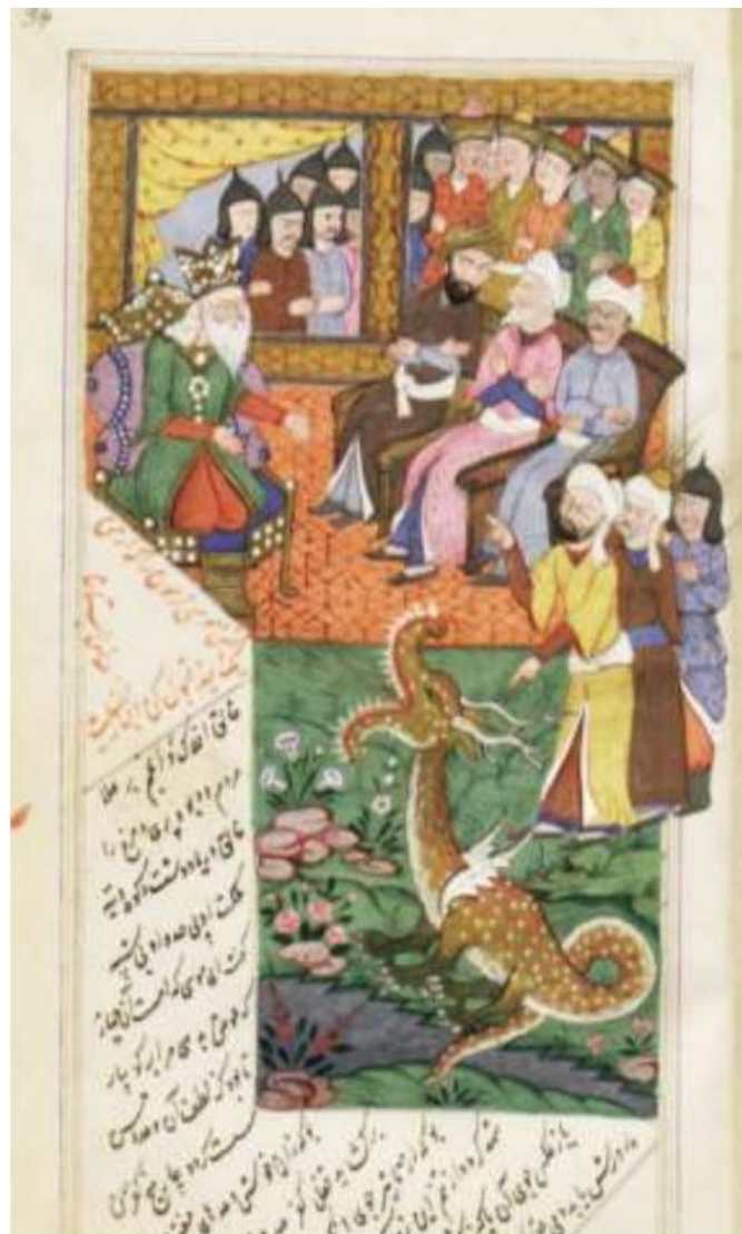
تصویر ۳: نگاره پند دادن موسی به فرعون، مثنوی معنوی مصور از دوره تیموری، قرن هشتم.

همه ارتباطات کلامی ایجاد شده فوق در جهت هدایت و امر به معروف و نهی از منکر مخاطب به شیوه حکایت هستند که همان استفاده از کارکرد ارجاعی زبان در ارتباطات کلامی است. در تصویر شماره (۳) پند دادن به عنوان نوعی ارتباط کلامی به تصویر کشیده شده است.