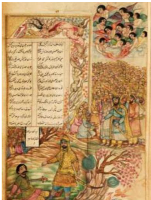
تصویر ۱: نگاره مبارزه علی (ع) با دشمنان، قرن هشتم هجری، نسخه مصور مثنوی مولوی، مأخذ: موزه آستان قدس رضوی.

در واقع از ویژگی‌های ارتباطات کلامی مثنوی، تأکید مولوی بر پیام حکایت و ارتباطات کلامی است چنانکه در بسیاری موارد خود حکایت را رها نموده نموده و هدف و پیام را به صورت مستقیم برای مخاطب بازگو نموده است. این امر بیانگر نقش ارجاعی کلام و ارتباطات کلام مولوی در مثنوی است. البته دانست که کلام و ارتباطات کلامی در مثنوی دارای نقش ترغیبی و ادبی نیز می‌باشند؛ چنانکه در بسیاری از ارتباطات کلامی مولوی با جملات امری مخاطب را به شنیدن داستان و حکایت دعوت می‌کند و چنانکه گفته شده تمام امکانات زبانی در مثنوی، همه برای رساندن معانی و مفاهیم بلند عرفانی و تعلیمی و پیام‌نهایی آنها به خدمت گرفته شده‌اند. مولوی با دعوت مخاطب خود که دیگران هستند سعی در ایجاد مفاهیم و هدایت آنها دارد و از آنها می‌خواهد به حکایتی که پند و تعلیمی را در بر دارد و حقیقت احوال درونی همه آدمیان است، گوش فرا دهند. در تصویر شماره (۱) نمودی از تصویرسازی تعلیمی مشاهده می‌شود.