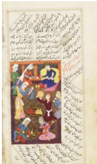
تصویر ۲: برگزاری از مثنوی مولوی، سرور پس از استجابت دعا، نسخ مصور مربوط به دوره تیموری، قرن هشتم.

مولوی با هدف ایجاد مفاهیم و هدایت، دیگران را مخاطب قرار می‌دهد و سعی در شناساندن حقایق وجودی انسان‌ها دارد. راوی در بیت اول این حکایت، خود مولوی است که مفاهیم تعلیمی و عرفانی را به مخاطب القاء می‌کند. بعد فضای حاکم بر حکایت را از طریق گفتگو برای مخاطب به تصویر می‌کشد و از زاویه سوم شخص به بیان این حکایت می‌پردازد. به طوری که گویی مولوی به مخفی‌ترین زاوایای روح شخصیت‌ها آگاه است و نه تنها درباره آنها همه چیز را می‌داند بلکه درباره همه کارها و اشیایی که آنها در خلال حوادث به نوعی با آن درگیر می‌شوند، اطلاع کامل و تجربه وسیع دارد. تصویر شمار (۲) ارتباط میان خالق و مخلوق را به نمایش گذاشته است.