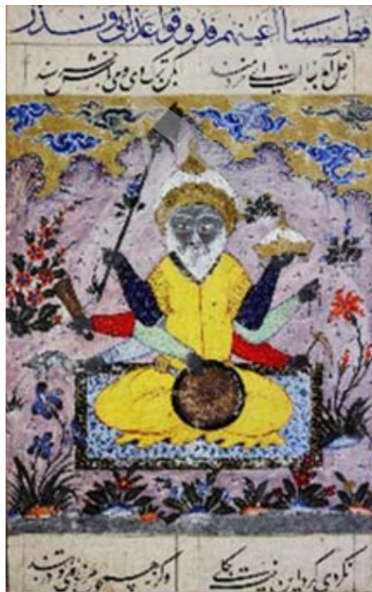
تصویر ۴. نگاره زحل. فالنامه فارسی. دوره صفوی. محل نگهداری: موزه توپقاپی سرای استانبول.