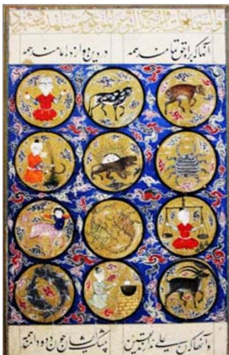
تصویر ۱: نگاره بروج دواذگانه، فالنامه فارسی دوره صفوی. محل نگهداری: موزه توپقاپی سرای استانبول.

درباره ریشه لغت اسطرلاب آورده‌اند: اسطرلاب یا اسطرلاب و استرلاب هم می‌نویسند. مأخوذ از یونانی؛ از آلات نجومی قدیم که برای برخی از اندازه‌گیری‌های نجومی و ارتفاع ستارگان و کشف بعضی مسائل و احکام مربوط به نجوم به کار می‌رفته و بر چند نوع بوده؛ از جمله مسطح و کروی. اسطرلاب مسطح، صفحه مدور فلزی بوده که بر آن، حروف و دوائر و درجه‌ها و نام‌های بروج، نقش بوده ... است (مشکوة، ۱۳۷۲: ۴). در شاهنامه، وقتی افراسیاب و کی خسرو، هر دو در انتظار زمان مناسب برای آغاز نبرد بزرگ می‌باشند: