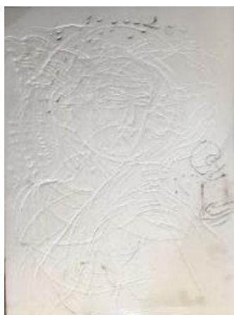
تصویر ۱. اتود ۵