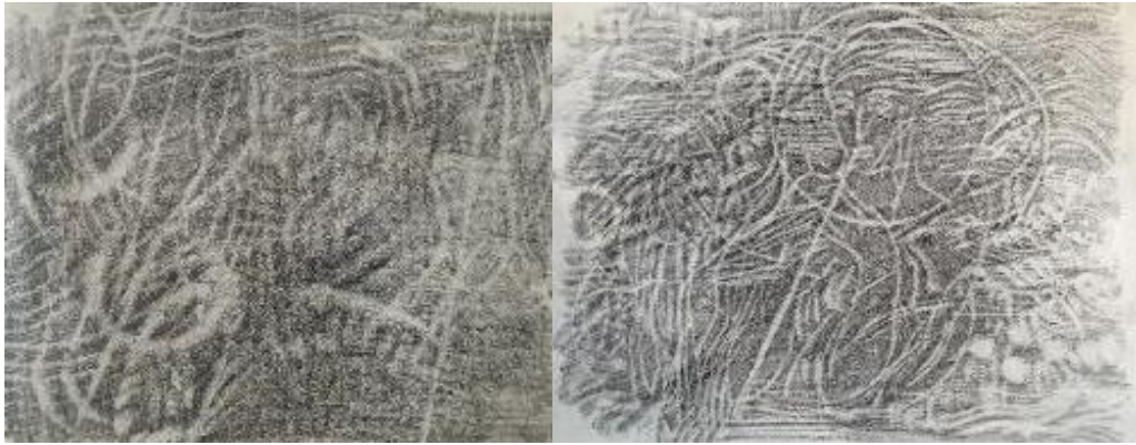
تصویر ۹. اتود ۵

آرمانی خود است. تعهد او نسبت به رئالیسم آثارش، و علاقه‌ی او به این سبک، در این اسکیس نیز مشاهده می‌شود. این مرحله برای هنرمند، مرحله‌ی تردید است چراکه در تجسدبخشی به المان‌های اثرش، هنوز به قطعیت نرسیده است.