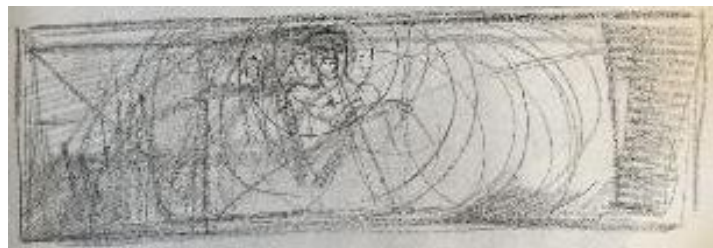
تصویر ۱۲. اسکیس ۳

در دو اتود بعدی (تصاویر ۸ و ۹) ترکیب‌بندی اثر، از حالت عمودی به افقی تغییر می‌کند. به‌علاوه، فضایی که فیگور در آن قرار می‌گیرد نیز وسیع‌تر می‌شود. المان‌های جدیدی که هنرمند در این مرحله به اتودهای خود اضافه می‌کند، اثر را به چندین سطح تقسیم نموده‌است. این تقسیم‌بندی به‌واسطه‌ی سطوحی مدور که در ارتباط با فیگور و عناصر پس زمینه هستند و تلاش می‌کنند، جایگاه مناسب خود را پیدا کنند، شکل می‌گیرد.