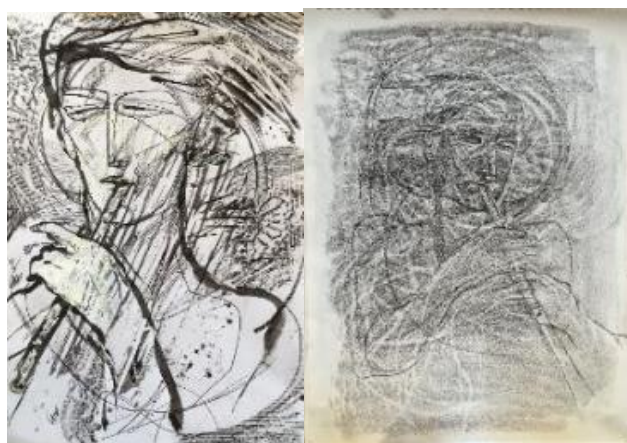
تصویر ۲. اتود ۶