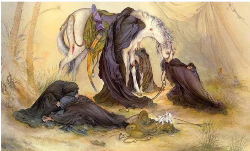
تصویر ۲: واقعه عاشورا. اثر استاد محمود فرشچیان. دوره معاصر.