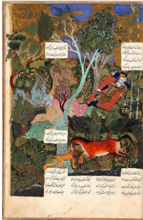
تصویر ۱: جدال شیر و رخس در شاهنامه محفوظ در موزه بریتانیا.

این شیر کپی که مشخصاً از عملۀ اهریمنان و جادوان و آسیبرسانان به آفریدگان هرمزدی است، وقتی به چشمه آب بغلتد و خیس شود، هیچ سلاحی بر وی کارگر نمی‌شود. در حقیقت با پوشیدن زره عنصر آب رویین تن می‌گردد.