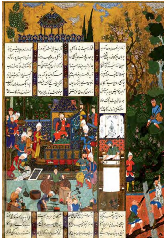
تصویر ۳: دربار جمشید. مکتب تبریز. شاهنامه محفوظ در موزه بریتانیا.

تصویر شماره ۳ نمایی از ساختمان کاخ جمشید را منعکس ساخته است.