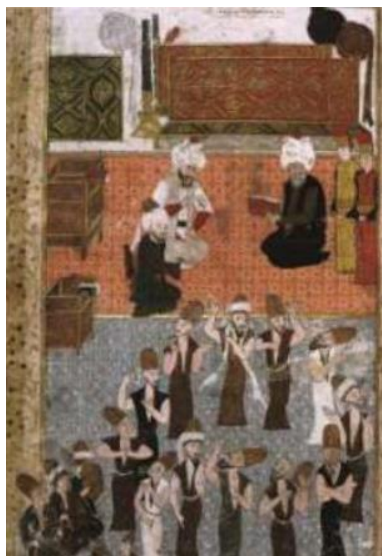
تصویر ۲. تصویر جمع صوفیان در معبد قونیه ترکیه. نصرت‌نامه. سده ۱۶م. مکتب عثمانی. محل نگهداری: موزه توپ‌قاپی