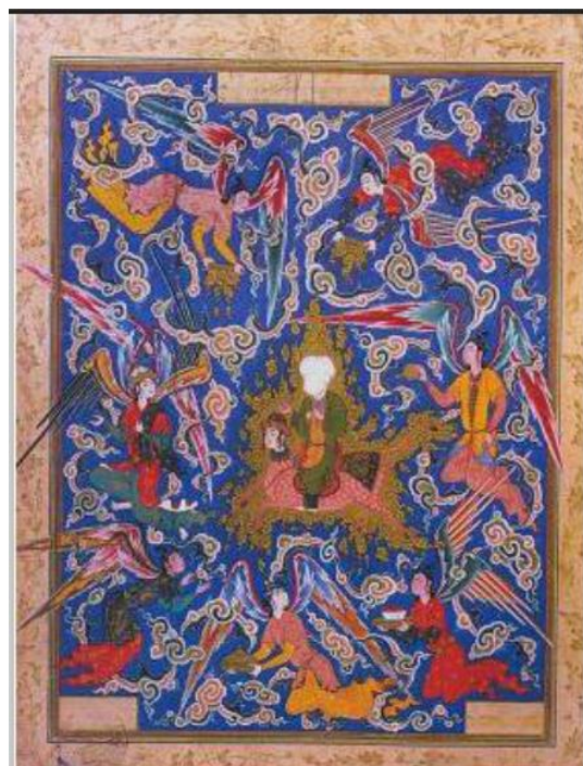
تصویر ۱. تصویر معراج پیامبر (ص). هفت اورنگ جامی. ۹۶۳ق. دوره صفوی. مکتب دوم تبریز.

عارف کسی است که در نیل به حقیقت جهان نه بر عقل و استدلال بلکه بر سیر و سلوک و دریافت و مجاهده و اشراق متکی بوده و هدفش به‌جای درک و فهم حقایق، وصول اتحاد و فنا در حقیقت است. علاقه‌مندی و تلاش عرفا برای دعوت از دوستداران حضرت حق به این بزم الهی، باعث توسل ایشان به هنرهایی چون شعر و ادبیات شده است. از این راه بود که عارفانی چون عطار نیشابوری، سعدی، حافظ و جامی، معارف و مبانی عرفان اسلامی را انتشار داده و به گوش مخاطبان‌شان رسانده‌اند. این مجموعه‌های عظیم شعر عرفانی بارها مورد استقبال نگارگران قرار گرفته است و به تصویر درآمده است (بابایی فلاح، ۱۳۹۱: ۸۱۰). تصویر شماره ۱ که معراج پیامبر را به تصویر کشیده است نمونه‌ای از این مضامین عارفانه است.