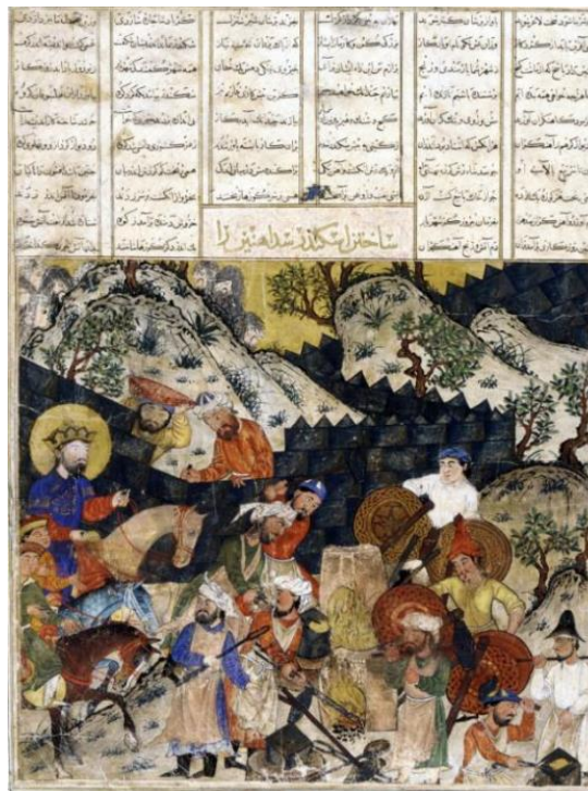
تصویر ۴: هاله نور دور سر اسکندر. برگه از شاهنامه. مکتب هرات اول. محل نگهداری: موزه اسمیت سونیان.

تلقی می‌گردد، لیکن نقش برجسته طاق‌بستان به علت قرار گرفتن ایزد مهر در کنار شاه بی‌نظیر می‌باشد. اولین کسی که برای نخستین بار به تصویر ایزد مهر در این نقش برجسته پی‌برد، فردینانت پوستی بود. وی مشابه این نقش را با همین هاله برگرد سر به روی سر سکه‌های شاهان کوشانی و کتیبه‌ای بر روی سکه‌ها به نام میترا تشخیص داده بود. تصویر ایزد مهر در نقش برجسته طاق‌بستان یگانه تصویری از این ایزد در ایران دوره ساسانی است (فرای، ۱۳۸۵: ۲۴۸-۲۴۷).