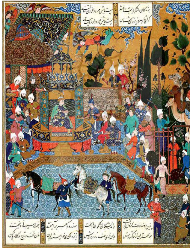
تصویر ۱: نگارهٔ دربار فریدون. شاهنامه. منسوب به قدیمی با مدیریت سلطان محمد. محل نگهداری: موزه ملی بریتانیا

در زمان هخامنشیان ایزد بانو آناهیتا با مهر بارها مورد ستایش واقع شده است. ستایش این دو ایزد در کنار اهورامزدا صورت می‌گرفت. در نیایش‌ها شاهان، مهر را به‌عنوان گواه ایمان آنان قرار می‌دادند لذا مهر در دین رسمی به مقام ارجمندی دست‌یافته و در تقویم و گاهنامه‌های رسمی نام هفتمین ماه سال را به‌خود اختصاص داده بود. در تقارن نام ماه و روز یعنی شانزدهم مهرماه روز مهر نام داشت در این روز در سراسر قلمرو هخامنشی جشنی تحت‌عنوان مهرگان که از جشن نوروز با اهمیت‌تر بود برگزار می‌شد. به هنگام مراسم جشن مهر، شاه ردای ویژه ارغوانی به تن کرده و مجاز بود در مراسم باده‌نوشی هر اندازه که بخواهد زیاده‌روی کند و در مراسم ویژه دست‌افشانی نماید (کومون، ۱۳۹۳: ۳۱-۳۰).