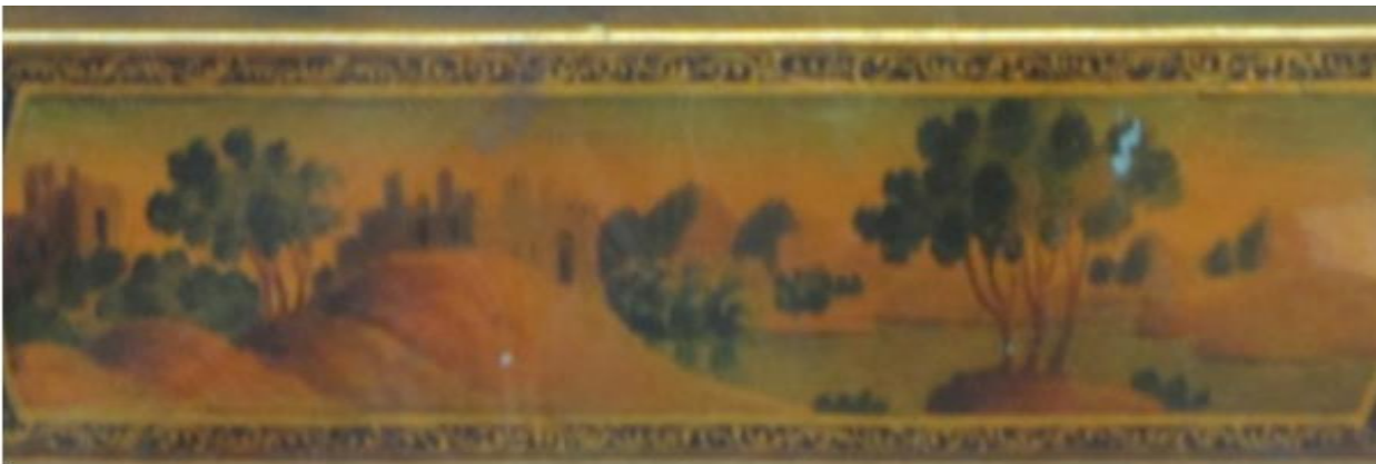
تصویر ۱: بخشی از ترسیم طبیعت در نمای قلمدان لاک. دوره قاجار.

عشق به مفاهیم ارزشی در بوف کور از طریق ستایش زیبایی‌ها و پاکی در وجود یک زن به‌خوبی توصیه نمایان شده و تلاشی را که در پی مرگ او برای احیای دوباره او دارد که نشانی از پیوند های اصیل یک انسان شرقی به هویت فرهنگی و بومی خویش است.