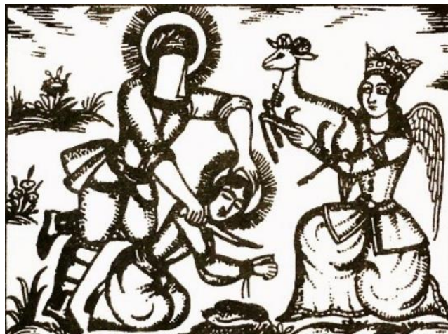
تصویر ۳: دستور جبرئیل به حضرت ابراهیم. (مأخذ: مارزلف: ۱۳۹۸).

ادغام تصاویر کهن از فرشته با سبک پوش و نقاشی غربی را می‌توان نوعی پست مدرنیسم در نقاشی این دوره دانست. اگرچه این جریان در دو دههٔ اخیر به دلیل عدم برخورداری نویسندگان از اطلاعات وسیع تاریخی، فرهنگی و روانشناسی که لازمه کار در این سبک بوده سیر نزولی داشت، اما در مجموع آنچه حق مطلب در این زمینه ایجاب می‌کند اینکه آثار پست مدرنیستی در ایران چون نیازی مبرم در درک و بیان واقعیت‌ها و حقایق زندگی انسان مطرح بود که بیانگر افکار و اندیشه‌های او از مجموع رویدادهای حاصله و معضلات بشری به همراه بیدارسازی و آگاهی او با فنون ادبی روز دنیا، همگام با نویسندگان مطرح پست مدرنیستی جهان پا به عرصه وجود نهاد که از طریق ایجاد پیوند با عمیق‌ترین و اصیل‌ترین اندیشه‌ها و احساسات بشری چون عشق، امید، تلاش، بقا، استقلال، نوع‌دوستی، هدفمندی و رشد مستمر در مسیر تکامل فردی و اجتماعی توانست که گام‌های مؤثری در جهت غنای ادبی و حفظ و رشد فرهنگ ملی همگام با نمونه‌های غربی در پاسخ‌گویی به نیازهای بشری دارد.