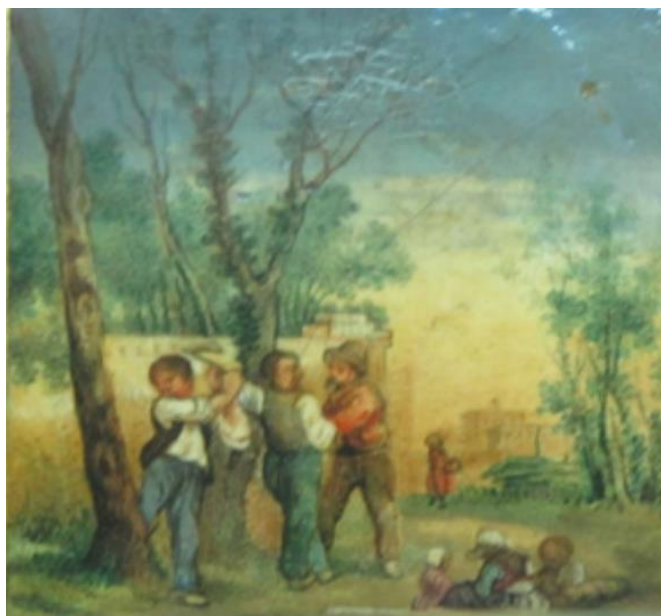
تصویر ۲. ترسیم شور زندگی در نقاشی‌های دوره معاصر.

رمان نوعی از اشکال ادبی، مظهر بیان عواطف، آرمان‌ها، نیازها و آرزوهای انسان بوده است. قالبی که همپای تحولات زمان تحول و تکامل یافته و علاوه بر انعکاس واقعیات دنیای خارج، تبلور اندیشه‌ها و دیدگاه‌های دنیای درون بوده است. نوعی منحصر به فرد از انواع ادبی که با کاربست فنون و تکنیک‌های نوین ادبی در زمان تلاش در بهبود شرایط زندگی انسان و افکار و اندیشه‌های او که در پیوند منطقی با فرهنگ و تاریخ گذشته داشته صورت گرفته است. رمان پست‌مدرن به‌عنوان شکل نهایی رمان در عصر حاضر علاوه بر نشان دادن ضعف‌ها و کاستی‌ها تلاش در انعکاس ابعاد پنهان زندگی او داشته است که از این طریق سعی در تنبه و بیدارسازی او در رسیدن به حقوق و جایگاه انسانی او بوده است. در نقاشی‌های پست‌مدرن معاصر نیز به وفور ترسیم زندگی روزمره دیده می‌شود. تصویر شماره ۲ نمونه‌ای از این تصاویر است.