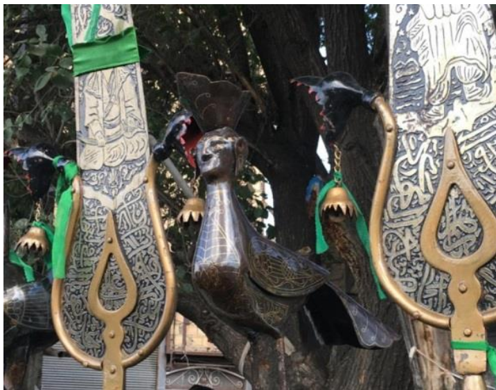
تصویر (۱۰): علامت ۱۱ تیغه- مرغ رخ طلا کوب- تبریز- محله چلیبی، (مأخذ: نویسنده- محرم ۱۳۹۸)

الف) مرغ رخ، مرغ خلیل یا هارپی: در فرهنگ لغت دهخدا در تعریف هارپی و مشخصات آن آمده است «نام سه موجود عجیب‌الخلقه بالدار است. چهره‌ی این موجود به چهره‌ی زن، بدن او به کرکس می‌ماند ناخن‌های برگشته دارد و مرگ و کشمکش شدید را تجسم می‌دهد» (دهخدا، ۱۳۷۳، هارپی).