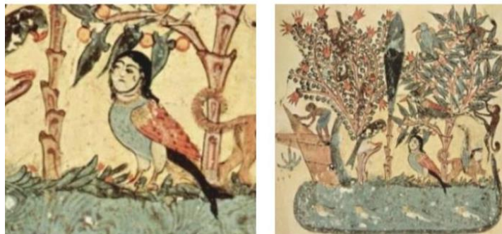
تصویر (۱۲): مقامات حریری، مکتب بغداد، منسوب به شیخ واسط حریری، (مأخذ: تالبوت رایس، ۱۳۸۴: ۱۰۶)

در مصر نیز "Ba" پرنده مصری بر فراز مومیایی در نقاشی‌های مقبره‌ای پرواز می‌کند. (در دوره سلطنت جدید) و نماد قدرت خدایان و فراعنه است. بعدها دلالت بر روح متوفی داشت و با پسوخه، یا روان یونانی یکسان شمرده شد. بسیاری از اقوام باستانی، پرندگان را با خورشید- خدایان و آسمان همراه می‌دانستند. گارودا خدای هندی، شکل یک پرنده داشت و مرکب ویشنو بود (هال، ۱۳۸۰: ۲۰). در ارزشمندترین منبع اسطوره‌های حیوانی و گیاهی چینی، متن کلاسیک کوه‌ها و دریاها بسیاری از اسطوره‌ها به پرندگان بدشگونی از قبیل پرنده‌ای شبیه به خروس با صورتی انسانی اشاره کرده‌اند (بیرل، ۱۳۸۴: ۶۹).