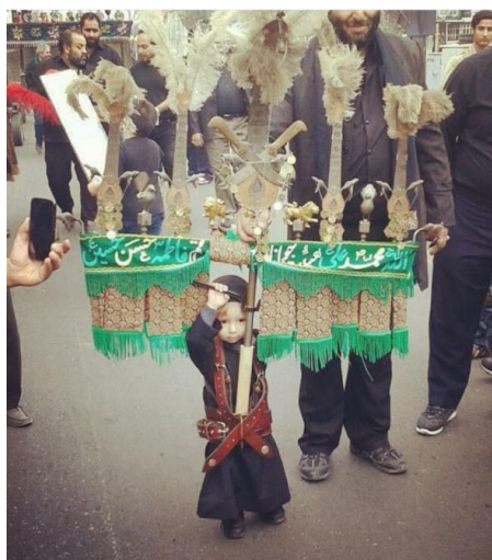
تصویر (۴): دختر بچه در حال علامت‌کشی، از صفحه اینستاگرام «علم‌سازان» تهران