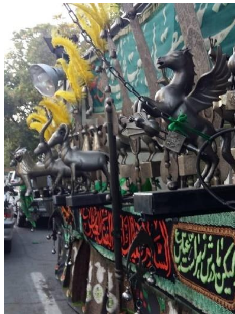
تصویر (۹): علامت ۲۳ تیغه-تبریز- محله مارالان، محرم سال ۱۳۹۸

این آرایه‌ها برخلاف عَلَم که توسط سازندگان، ساخته می‌شود توسط علمداران بسته به ذوق و سلیقه آنها سفارش داده شده، ساخته و نصب می‌گردد. اصل اجزاء عَلَم تیغه‌ها، مرغ خلیل، اژدهای انتهای عَلَم، شال و پَر می‌باشد و مابقی جزء آرایه‌های عَلَم که آنها نیز از نظر اهمیت درجه‌بندی دارند می‌باشند (خانعلی‌زاده طارمی، ۱۳۹۰؛ ۱۵).