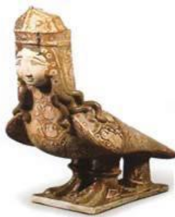
تصویر (۱۳): مجسمه هارپی سفالی و لعابی دوره سلجوقی که به احتمال زیاد مؤنث است.

یکی دیگر از تندیس‌های پر کاربرد روی علامت‌ها مرغ رُخ است که در مورد حضور آن ۲ تعبیر کاملاً متفاوت در منابع وجود دارد. مرغ رُخ، پرنده‌ای است با تمثیل انسانی که شاید از «براق» (اسب حضرت محمد در شب معراج) تعبیه شده است گویی شهدای واقعه‌ی عظیم کربلا توسط این مرغ به آسمان‌ها صعود کرده و در فردوس خدای مهربان وارد شدند.