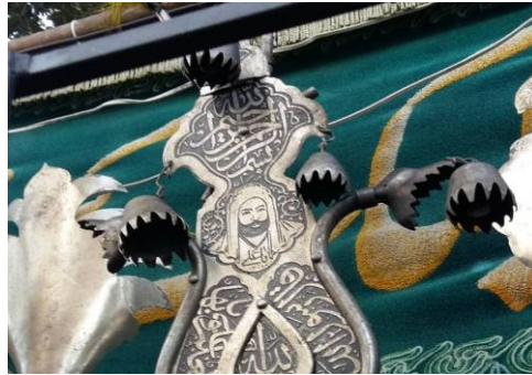
تصویر (۲۰): علامت ۲۳ تیغه-زنگوله حیدری-تبریز-محلّه ماران، (منبع: نویسنده-محرّم ۱۳۹۸)

محلی بر شما بسیار سخت گذشت، سه مرتبه فرمودند: الشام الشام الشام. صدای زنگ نمادی از این مصیبت‌هاست که معمولاً در هنگام حرکت علم صدای زنگ‌ها به گوش می‌رسد، که برای اهل هیأت و آگاهان بسیار حزن‌آور، غم‌انگیز و دردآور است. زنگوله اشاره‌ای به زنگ کاروان و ضجه کودکان امام حسین (ع) و اسرای کربلا دارد (خانعلی‌زاده طارمی، ۱۳۹۰: ۱۱۳). برخی هم آن را مرتبط به ماجرای ساکت شدن زنگوله‌های شتران در ابتدای خطبه حضرت زینب در شام می‌دانند. پس از واقعه عاشورا، هنگام ورود کاروان اسرای کربلا به کوفه، حضرت زینب (س) خطبه‌ای خواندند و در آن مردم کوفه را از گناهی که بخاطر یاری نکردن امام حسین (ع) مرتکب شدند، آگاه کرد. با یک کلام و دستور آن حضرت همه مردم و حاضران مجبور به سکوت می‌شوند. حضرت زینب (س) به مردم اشاره کردند که ساکت شوید و ناگهان نفس‌ها در سینه‌ها حبس شد و زنگ شتران از صدا افتاد، و سپس خطبه را آغاز نمود (علامه مجلسی، ۱۰۳۷-۱۱۱۰ هجری؛ جلد دهم).