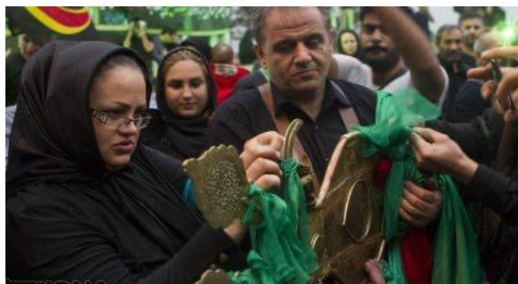
تصویر (۵): بانوان و دختران در حال نذر و طلب حاجت و نظارت از دور.