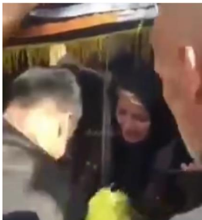
تصویر (۳): علامت‌کشی یک بانو در تهران با کمک چند علامت‌کش مجرب مرد در تهران.