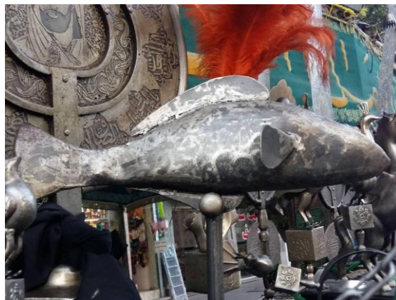
تصویر (۱۹): علامت ۲۳ تیغه- تندیس ماهی- تبریز- هیات خیابان مارالان، (منبع: نویسنده- محرم ۱۳۹۸).

ماهی بیشتر در علامت‌های بزرگ و با عظمت منطقه مورد بررسی رؤیت شد نه در همه علامت‌ها.