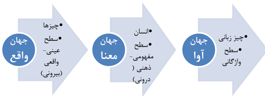
تصویر ۱: سه سطح تحلیل معنایی- زبانی چیزها

تمام واژه- مفهوم‌های نوشتاری/ گفتاری، مشخص‌ترین و قابل اشاره‌ترین مرز را در سطح واژگانی دارند که در آن، به‌صورت کلمه‌ای با شکل و یا آوایی خاص قابل شناسایی هستند. این واژه- مفهوم‌ها، بسته به سطح انتزاع یا واقعیت آن‌ها، یعنی باتوجه‌به اینکه قابلیت اشاره به آن‌ها در جهان واقع بیشتر باشد یا در جهان معنا، در آن سطح، دارای تشخیص، مرز و قابلیت اشاره بیشتری هستند. یکی از عام‌ترین و بزرگ‌ترین انتزاعات جهان معنی، مفهوم- واژه «هستی» است که در سطح معنی، کاملاً قابل اشاره و دارای مرز خاصی با تمام چیزهای است که هستی ندارند و