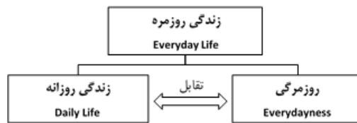
شکل ۱. ساختار مفهومی زندگی روزمره

خود را نیز دربرمی‌گیرد (۹: ۱۹۸۷, Lefebvre). از نگاه لوفور (۱۹۸۷) زندگی روزمره بستر کلی زندگی عادی انسان‌هاست که به دلیل در اختیار گرفتن قدرت تبدیل به روزمرگی با ریتم خطی می‌شود. این مفهوم در عین اینکه مفهومی جهانی است، منحصر به فرد است. اجتماعی است در عین اینکه خصوصی است. آشکار است؛ درحالی که پدیده‌ای پنهان است. لذا با توجه به پیچیدگی این مفهوم، تبیین آن به‌عنوان یکی از کلیدی‌ترین مفاهیم این مقاله از اهمیت ویژه‌ای برخوردار است.