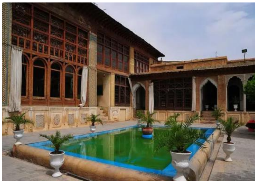
تصویر ۳. موقعیت خانه نصیرالملک. شیراز

براساس پذیرش حرکت جوهری، سراسر عالم ماده و طبیعت یکپارچه حرکت است. بر این اساس، معرفتی که از اشیاء مادی به ظاهر ثابت و پایدار، از حیوان گرفته تا نبات و جماد حتی صخره و پولاد، به دست می‌آید، به واقع معرفت به یک واقعیت نیست، بلکه معرفت به واقعیت‌های فراوان و حتی قسمت‌ناپذیر است. بنابراین، خود معرفت هم، شناخت واحدی نیست بلکه در حقیقت، معرفتی گسسته و تغییرپذیر و ناپایدار است (گرجیان و زندیه، ۱۳۸۹: ۶۹). این ویژگی حرکت جوهری با آموزه‌های آیین مهری در مثنوی مولانا مطابقت دارد.