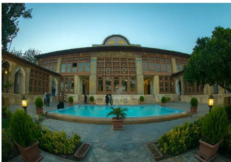
تصویر ۲. خانه زینت‌الملک. شیراز.

آب به عنوان یکی از اساسی‌ترین عناصر طبیعی، از دیروز تا امروز، تأثیر به‌سزایی در شکل‌گیری اثربخشی فضاهای شهری داشته و همواره جلوه‌های مختلف آن باعث تهیج و تحریک گرایش انسان به زیبایی شده است. نقش آب در شکل‌گیری نخستین زیستگاه‌های انسانی پاسخی است به یک نیاز زیستی. اما وقتی فراتر از یک نیاز، خانه‌سازی و بنای مجموعه‌های مسکونی بار فرهنگی می‌گیرد. معماری پدید می‌آید و آب در زندگی انسان جایگاه هنری پیدا می‌کند از خلاقیت هنرمندان و معماران ملیه می‌گیرد. درک مفهوم آب در معماری همان درک معماری آب است. درک قوانین فیزیکی رفتار آب، احساسات ما در مقابل کنش و واکنش آب مهم‌تر از همه نقش و ارتباط آن با زندگی انسان‌ها است. آب، به همراه خاک، آتش و هوا، عناصر چهارگانه تشکیل‌دهنده جهان هستی به‌شمار رفته است. در ایران باستان، معماری به‌سوی آب حرکت می‌کند و در کنار آن آرام می‌گیرد. ولی در دوره اسلامی آب در معماری حالت کاربردی پیدا می‌کند و معماران آگاهانه سعی می‌کنند تا به طبیعت تسلط یافته و آن را به نظم بکشاند و با شناخت قوانین فیزیکی و رفتار آب و درک نقش و ارتباط آن با انسان آب را به درون معماری بکشانند (ثانی و همکاران، ۱۳۹۵: ۱).