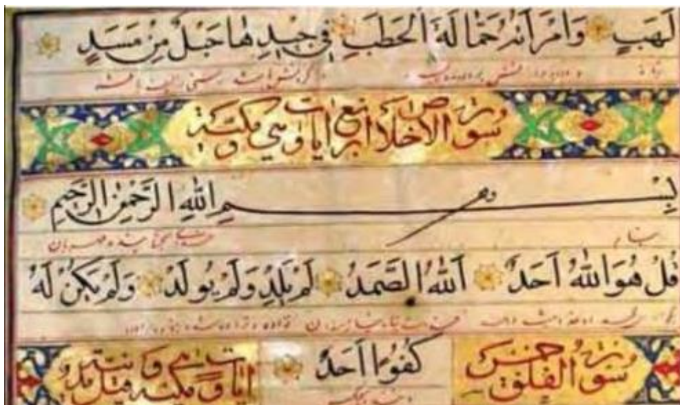
تصویر ۲. خوشنویسی در قرآن، به خط ضیاء السلطنه، دوره قاجار، آستان مقدس حضرت معصومه قم.

گفته شده است که: «در حقیقت این تشبیه، یک تشبیه تمثیلی است که در آن حالت و شکل باغ به دلیل حادثه وارد شده بر آن به شب تشبیه شده است و وجه شبه شامل سیاه شدن به دلیل سوختن است» (قونوی، ۱۴۲۲: ۳۳۸/۱۹) و یا تشبیه باغ سوخته به شن و ماسه‌ای است که چیزی از آن نمی‌روید و مشبه به در اینجا حسی است و آن کلمه «مصروم» است (همان: ۳۳۸). همان‌طور که مشاهده می‌شود به دلیل گستردگی معنای کلمه «صریم» و به مدد عنصر تشبیه، در این آیه، صحنه‌های شگفت‌انگیز و متعددی به تصویر کشیده شده است. اگر صریم را به معنای تاریکی و شب در نظر بگیریم، می‌توانیم صحنه‌ای را به تماشا بنشینیم که در آن باغ مذکور در اثر سوختن درختان به مانند شب، تاریک گشته است و چنانچه معنای ریگزار و شن و ماسه را برای این کلمه در نظر بگیریم، می‌توانیم آن باغ را بعد از ویران شدن به صورت ریگ‌زاری خشک و بی‌آب و علف در ذهن مجسم کنیم.