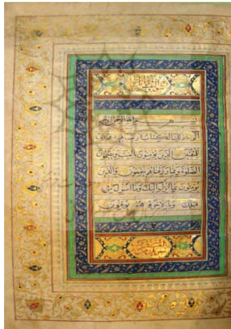
تصویر ۳. خوشنویسی در قرآن، دوره قاجار، مأخذ: آستان مقدس حضرت معصومه (س) قم.