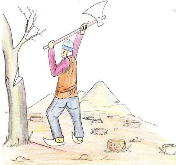
تصویر شماره ۲ نقاشی با موضوع قطع درختان