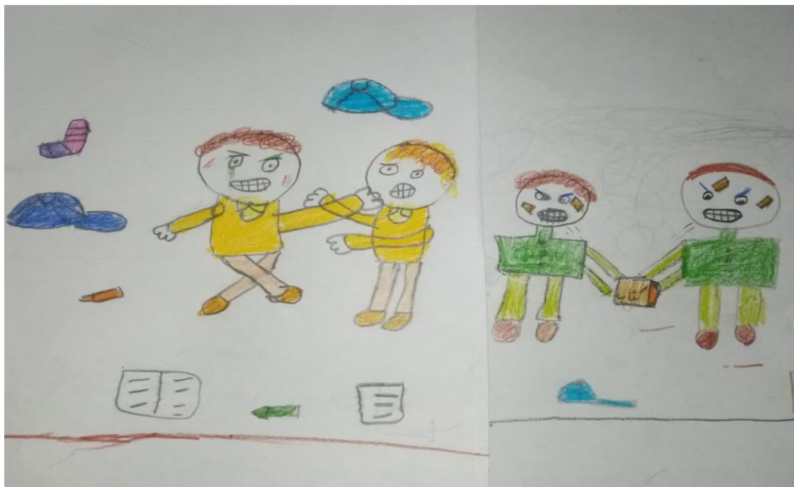
تصویر شماره ۳ نقاشی با موضوع خشونت و دعوا