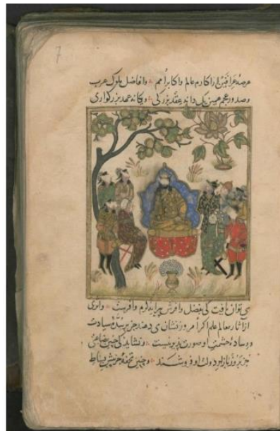
تصویر ۱. نگاره مشورت در مرزبان‌نامه. کتابت ۶۹۸ ه.ق. محل نگهداری: موزه توپقاپی استانبول