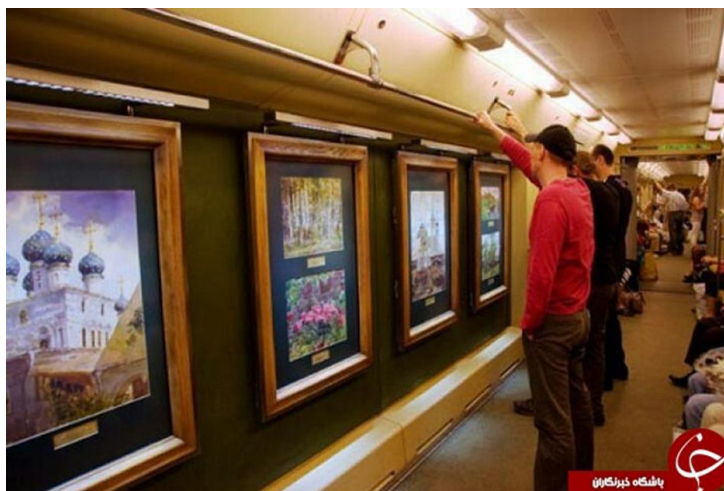
تصویر ۵. توجه مسافران مترو به تابلوهای نقاشی موجود در قطار

موقعیت استفاده‌ی عموم از این وسیله‌ی نقلیه این سطح از آگاهی به شدت موردنیاز است و کارهایی مفید در این زمینه به انجام رسیده است.