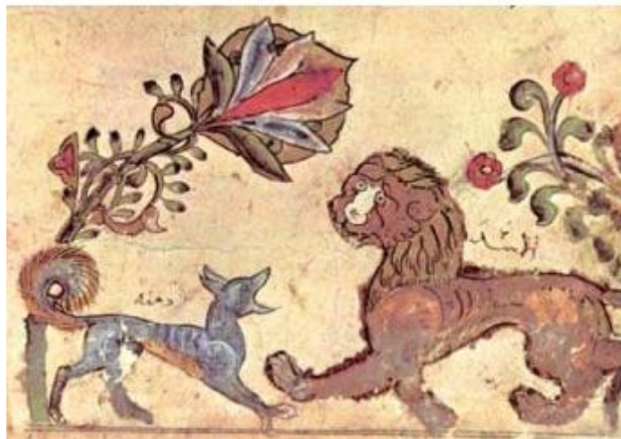
تصویر ۳. نگاره سخن گفتن دمنه با شیر. کلیله و دمنه مربوط به دوره ایوبیان. قرن هفتم