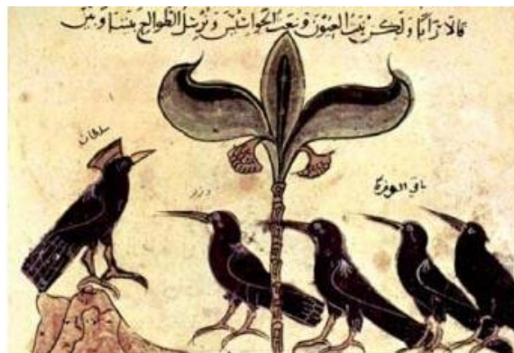
تصویر ۴. مشورت سلطان کلاغ‌ها با افراد. کلیله و دمنه مربوط به دوره ایوبیان. قرن هفتم