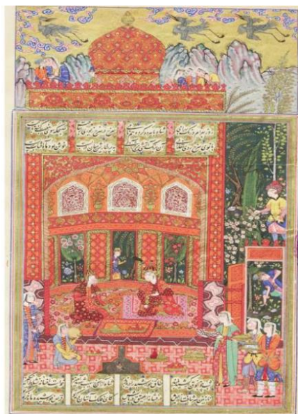
تصویر ۱. نگاره گنبد سرخ، هفت پیکر نظامی، دوره صفوی. محل نگهداری: مدرسه عالی شهید مطهری.

هفت پیکر براساس زندگی بهرام و بر مبنای عدد پر رمز و راز هفت سروده شده است، چنانکه خود هفت نیز هفت‌تاست؛ از جمله آن‌ها هفت سیاره و هفت روز هفته است. نظامی در این منظومه در سه موضع از سیارات نام برده است. در توصیف معراج نبی مکرم اسلام (ص)، در توصیف هفت گنبد و در داستان‌های هفت‌گانه. او در دو موضع اولیه، ترتیب و قواعد علمی و نجومی رایج روزگار خود را رعایت کرده است، اما در موضع سوم شیوه دیگری در پیش گرفته که آن نیز مبنای علمی دارد (براتی، ۱۳۸۷: ۲۱).