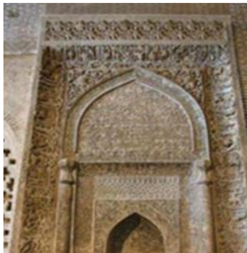
تصویر ۲. کتیبه محراب مسجد جامع اصفهان.

از این دوره به بعد آرایه‌ها نقش اساسی در معماری دوران اسلامی ایفا می‌کنند. عنصر رنگ نیز از اواخر همین دوره به جمع تزئینات معماری می‌پیوندد و نویدبخش کاشیکاری‌های زیبای قرون بعدی می‌شود (جاودان، ۱۳۹۹: ۱). در تصویر شماره ۲ که کتیبه محراب مسجد جامع اصفهان است دعای نا دعلی نگاشته شده است.