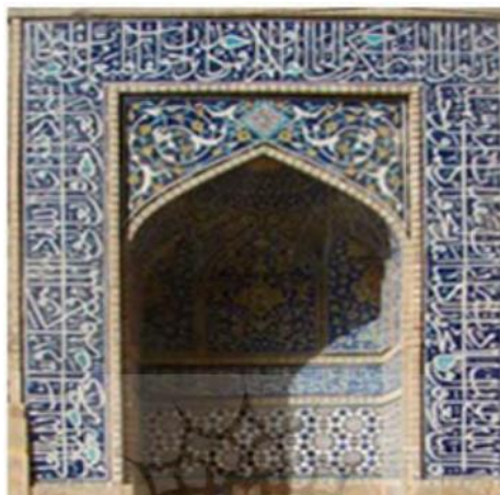
تصویر ۳. کتیبه‌های قرآنی ورودی مسجد جامع اصفهان.

رواج داشته است (ساکي، ۱۴۰۱: ۴۷۷). تصویر شماره ۳ نمونه‌ای از کاربرد گسترده آیات قرآنی در تزئینات ورودی مسجد جامع اصفهان را نشان می‌دهد.