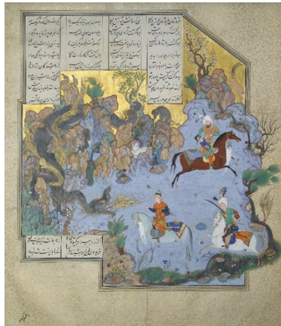
تصویر ۳. فریدون در هیبت اژدها، شاهنامه شاه‌طهماسبی، دوره صفوی. مکتب دوم تبریز.

دگرذیسی ضحاک به فریدون اگرچه سخت به نظر می‌رسد و دور از ذهن است، اما نشانه‌هایی می‌توان یافت که امکان دارد این اتفاق نیز در حوزه اسطوره رخ داده باشد. در نگاه نخست، بنابر دلایلی فردوسی نیز در شاهنامه به آن اشاره کرده است. چنانچه گفته شد ضحاک و اژی‌دهاک بنابر اساطیر یکی هستند و در حقیقت ضحاک همان اژی‌دهاک اسطوره‌ای است؛ از طرف دیگر، فریدون هم‌اورد اژی‌دهاک در جریان خواستگاری دختران شاه یمن خود را به چهره اژدها نمایان می‌سازد که شاید بتوان آن را نوعی دگرذیسی دانست. تصویر شماره ۳ فریدون در یک دگرذیسی و در هیبت اژدها یکی از پسران خود را می‌آزماید.