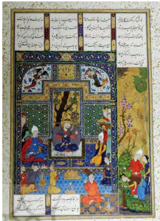
تصویر ۲. پیدایش مار بر دوش ضحاک. شاهنامه شاه طهماسبی. مکتب دوم تبریز.

درباره این که ضحاک و اژی دهاک یکی هستند و در حقیقت، ضحاک همان اژدهاست، سخن بسیار گفته شده است. در شاهنامه فردوسی اژی دهاک یا ضحاک پادشاه ستمگری است که بر روی شانه‌هایش دو مار روئیده است و این پادشاه ستمگر برای خوراک سر ماران خویش هرروزه جوانان بسیاری را به کام مرگ می‌کشیده است. تصویر شماره ۲ از شاهنامه شاه‌طهماسبی این روایت درباره ضحاک را به تصویر کشیده است.