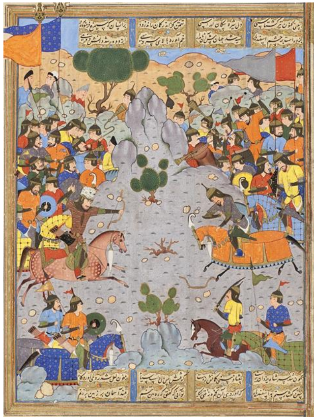
تصویر ۱. نگاره نبرد رستم و اسفندیار. شاهنامه شاه پهلماسیبی، دوره صفوی، مکتب تبریز. محل نگهداری: موزه هنرهای معاصر تهران