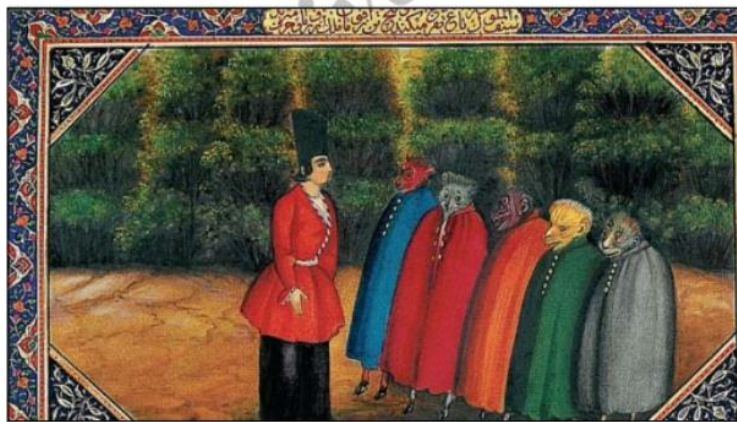
تصویر ۳. نمونه‌ای از موجودات غریبه در نسخه مصور هزار و یک شب صنیع‌الملک. محل نگهداری: کاخ گلستان

موجود عجیب: موجودات عجیب دیگر که نامی ندارند و ترکیبی از حیوانات مختلف هستند و با ظاهری ترسناک در جزیره‌ای دور افتاده سکونت دارند: «... چشمش بر جانوری افتاد که سرش مثل گاو و پایش مثل فیل و گردن و دست مثل شیر و رو به شاهزاده کرد» (همان: ۶۷). «چشم شاهزاده بر جماعتی افتاد که قدشان مثل منادی و دست‌هایشان مثل چناری و سنگ‌های آسیا را سوراخ کرده به‌جای طوق در گردن انداخته بودند و هرکدام درخت عظیمی بر دوش گرفته می‌آمدند و روشنایی که می‌نمود چشم‌های ایشان بود» (همان: ۶۸). تصویر شماره ۳ نمونه‌ای از ترسیم این موجودات در نسخه مصور هزار و یک شب صنیع‌الملک است.