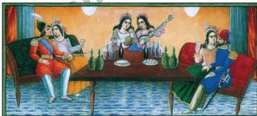
تصویر شماره ۹. مجلس بزم. نسخه مصور هزار و یک شب صنیع‌الملک. محل نگهداری: موزه کاخ گلستان

مهمانی و مجلس بزم: در فرهنگ ایرانی، مهمان بسیار عزیز و محترم است؛ بنابراین در مراسم مهمانی بهترین لوازم را برای پذیرایی آماده می‌کردند. «چشم ایشان بر بارگاه ملوکانه‌ای افتاد که اسباب زر و گوهر به روی هم ریخته و میناهای می‌ناب گذارده و سوای آن جوان کسی دیگر در آن مکان نبود» (همان: ۲۹). «فرش‌های ابریشمی رومی انداخته و خدمتکاران به کارشان مشغول می‌بودند و سازنده و نوازنده و رقص در رقص بودند» (همان: ۴۹). «نوش آفرین اشاره به ساقی کرد که می به گردش در آورد. رقصان به رقص در آمدند و سازنده‌ها و نوازنده‌ها به نواختن نی و طنبور و کمانچه و چارتار و سنتور و قانون شروع کردند» (همان: ۴۹). «چون شب شد میمونه‌خاتون از جا جست و خود مشاطه گردید و نوش آفرین را چون طاوس مست آراسته گردانید و آنچه لازم بود به‌جا آورد. تمام دیوان و پریان را فرمود تا از روی هوا شمع‌های زرینو مشعل‌های سیمین روشن گردانیدند. پادشاه با تمام امرا و وزرا و ارکان دولت شاهزاده را برداشته روانه حرم گردیدند. چون به دریند سیم رسیدند که امرا ایستاده بودند، پادشاه شاهزاده را داخل حرم کرد و گیس‌سفیدان و مشاطگان پیش رفتند و او از شاه گرفتند و به خلوتخانه بردند و بر تخت نشاندند» (همان: ۱۵۵). این فرهنگ عامه در نگاره‌های نسخه مصور هزار و یک شب صنیع‌الملک نیز منعکس شده است.