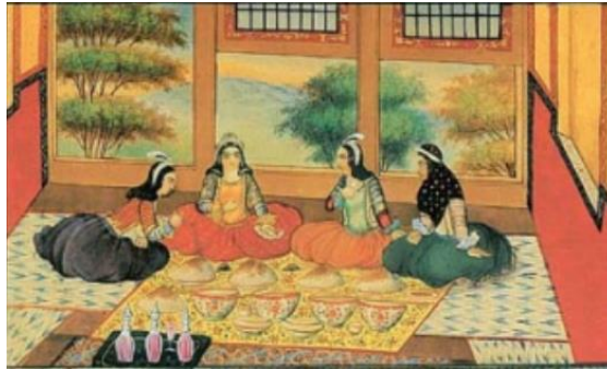
تصویر ۸. غذا در نسخه مصور هزار و یک شب صنیع الملک. محل نگهداری: موزه کاخ گلستان

صدقه دادن: صدقه دادن تلاشیست نیکوکارانه برای دفع بلا و آسیب که برای جلوگیری از حادثه داده می‌شود و گاهی بعد روی دادن اتفاق ناگوار و برای خوشحالی و شکرگزاری داده می‌شود. «غرض، شاهزاده را علاج می‌کردند تا بعد از چهل روز چاق گردید و زهر از عروقتش بیرون رفت. شاهزاده را به حمام بردند و از حمام بیرون آوردند و میمونه خاتون و شاه‌عبدالرحمن و جمیع پریان و خان محمد وزیر و حمید ملاح تصدق بسیار به فقرا و مساکین دادند» (همان: ۹۴). «شاه والجاه بسیار شادمان و فرحناک گردید و بر آزادی بندیان اجازه داد، احسان بر عجزه و مساکین نمود» (همان: ۲۳). «شاهزاده بر آن‌ها رحم آورده آب در حلقه چشم گردانیده آن‌ها را بخشید و خلعت داد و بر تخت خود نشاند و فرمود تا هزار گوسفند فربه از پوست برآورده رخ را آواز داد و گفت بیا اینها را از برای بچگان خود بردار» (همان: ۱۱۰). نام گذاری: نام گذاری، رسمی بوده است که بعد از تولد نوزاد، او را به دست بزرگی که یا از بزرگان خانواده یا بزرگ دینی بوده می‌دادند تا نامی برای او انتخاب کند، که در بین مسلمانان اذان و اقامه نیز در گوش نوزاد خوانده می‌شد و نام مناسب برای او انتخاب می‌شد. «پس آن نازنین را برداشت و اذان و اقامه در گوش او گفت و تاجی مکلل بر سر او گذارد و او را نوش‌آفرین گوهر تاج اسم گذارده به دست شاه داد» (همان: ۲۳).