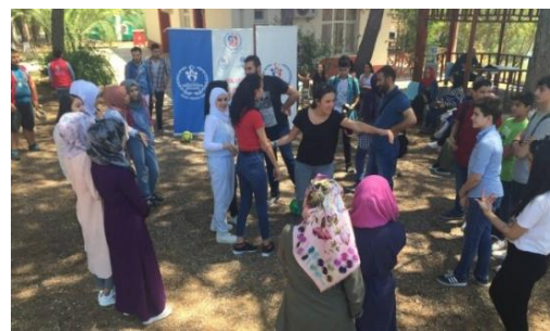
تصویر ۳. اجتماع محلی در یکی از محلات استانبول

مردمانی که خود زندگی در کنار دیگران را انتخاب می‌کنند خود نیز به رشد و نمو این اجتماع کمک خواهند کرد. یکی از موارد بسیار پررنگ در محله ترکی نقش گذر محلی در ارتباط همسایگی است. ساکنان محلی با هم‌نشینی در گذر محلی به تعاملات اجتماعی می‌پردازند که تا امروز نیز ادامه یافته است؛ همچنین مسجد که علاوه بر آن که در هر محله وجود داشت گاهی چند محله هم‌جوار از مسجد بزرگ محله دیگر استفاده می‌کردند که خود نقش بسیار زیادی بر انسجام و تعاملات اجتماعی میان محلات هم‌جوار، ارتباط و صمیمیت ساکنان آن‌ها با یکدیگر داشته و دارد.