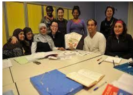
تصویر ۵. اجتماعات کوچک محلی در مراکز محلی در مراکش

به‌طور کلی استخوان‌بندی اصلی محله در مراکش را می‌توان مجموعه‌ای از کوی‌ها (درب) در نظر گرفت که در داخل هرکدام از این درب‌ها یک زاویاس برای اجتماع همسایگی و انجام کارهای دینی وجود دارد، به‌گونه‌ای که ارتباط همسایگان دیواربه‌دیوار تا انتهای کوی تأثیر بسیار زیادی بر انسجام اجتماعی می‌گذارد. درب‌ها هرکدام جداگانه