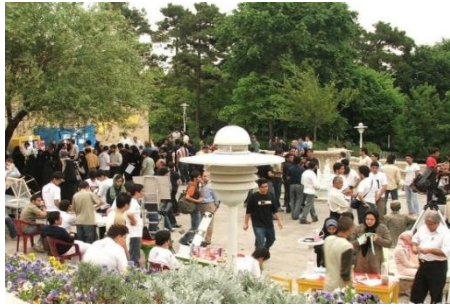
تصویر ۲. برگزاری رویداد محلی در پارک محله یوسف‌آباد تهران.