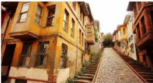
تصویر ۴. محله بلات (لاسکین، ۲۰۱۶: ۲۱)