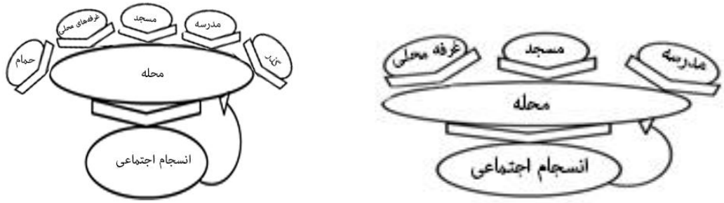
شکل ۱۱. عناصر معاصر سازی شده تأثیر گذار بر انسجام محلی شکل ۱۰. عناصر تأثیر گذار بر انسجام محلی در گذشته