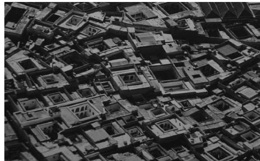
تصویر ۶. بافت شهر مراکش و محله زویا لخد ۱۵ (دیارت و همکاران، ۲۰۰۷: ۳۲۲).

انسجام اجتماعی و تعامل با همسایگان به‌نوعی در هر سه کشور بسیار ارج نهاده می‌شود (تصاویر ۳، ۲، ۱ و ۵)، اما در جزئیات تفاوت‌هایی وجود دارد که در بخش تحلیل به‌طور کامل به آن پرداخته شده است. با پرداختن به آن‌ها می‌توان در معاصر سازی‌ها هدفمندتر حرکت کرد تا به نتایج بهتری در توسعه‌های شهری دست یافت.