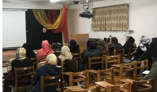
تصویر ۱. کارگاه سلامت روان برگزار شده توسط سرای محله