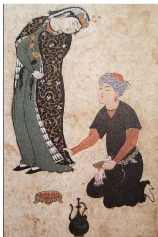
تصویر ۱. نگاره عاشق و معشوق. منسوب به شیخ‌زاده. بخارا. حدود ۱۵۳۰

سبک تک‌نگاری در نگارگری ایرانی از دوره صفویه گسترش یافت و هنرمندان متعددی در این سبک به خلق آثار خود پرداخته‌اند. در این میان، مضمون عشق یکی از اصلی‌ترین مضامین در این سبک از نگارگری ایرانی است.