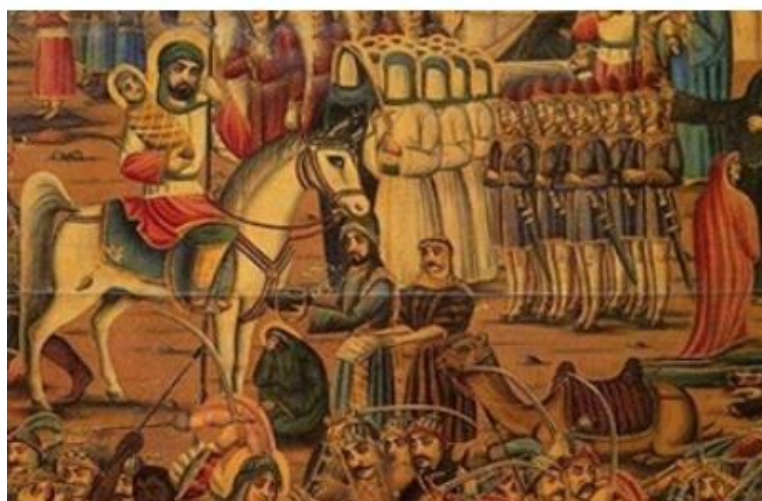
تصویر ۲. مصیبت کربلا. محمد مدبر. موزه رضاعباسی

این حماسه در طول قرن‌ها دست‌مایه‌ای برای خلق آثار هنری و ادبی بوده و آثار به‌وجود آمده با این مضمون به‌گونه‌ای وارد زندگی مردم ایران شده است که به بخشی جدایی‌ناپذیر از فرهنگ این سرزمین تبدیل شده‌اند. در نقاشی قهوه‌خانه‌ای و پرده‌های درویشی که توسط نقالان برای روایت داستان‌های گوناگون در میان مردم و قهوه‌خانه‌ها به‌کار می‌رفت نیز یکی از موضوعات اصلی، قیام عاشورا است. تصویر شماره ۲ نیز به حضور اهل بیت در کربلا پرداخته است.